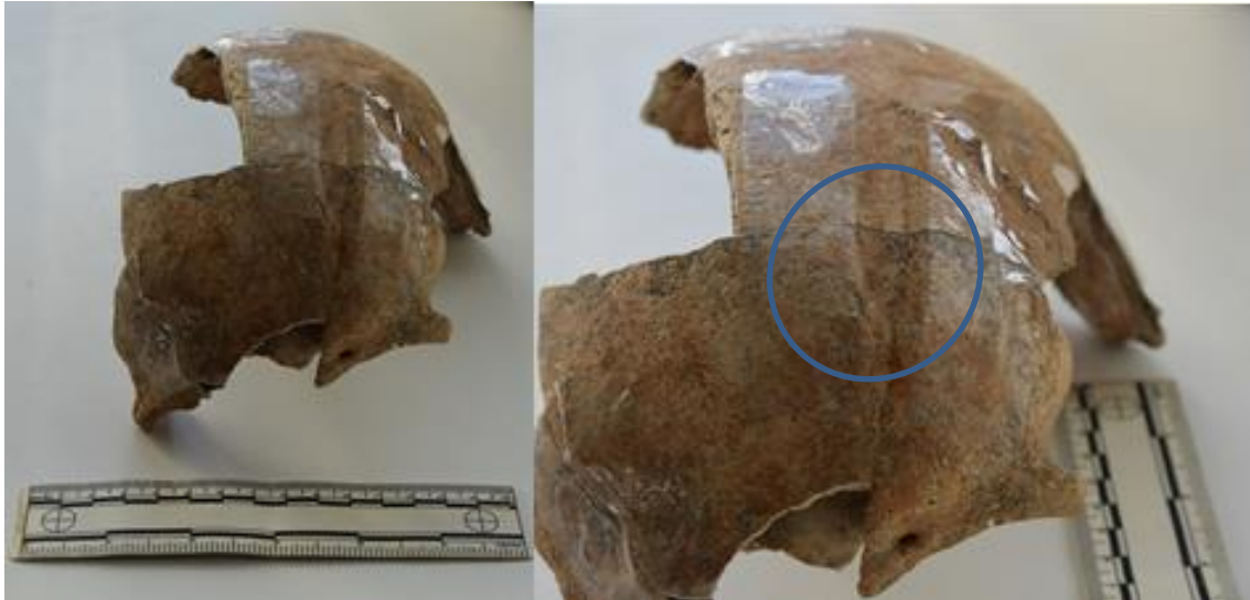
Slika 18. – Prikaz perimortalne traume na čeonj kosti

Koštani ostaci najvjerojatnije pripadaju muškarcu čija se dob procjenjuje na 40-49 godina. Procjena se temelji na stupnju sraslosti zglobnih ploha, šavova, osteoartritisa i zubnog statusa. Prisutna je fragmentirana kalota lubanje s vidljivim znakovima otitis media . Na čeonj kosti, 41 mm iznad lijeve orbite, nalazi se trauma, točnije udubljenje dimenzija dužine 39,5 mm, a širine 9,8 mm (Slika 18). Trauma je nastala udarcem tupotvrdim predmetom.