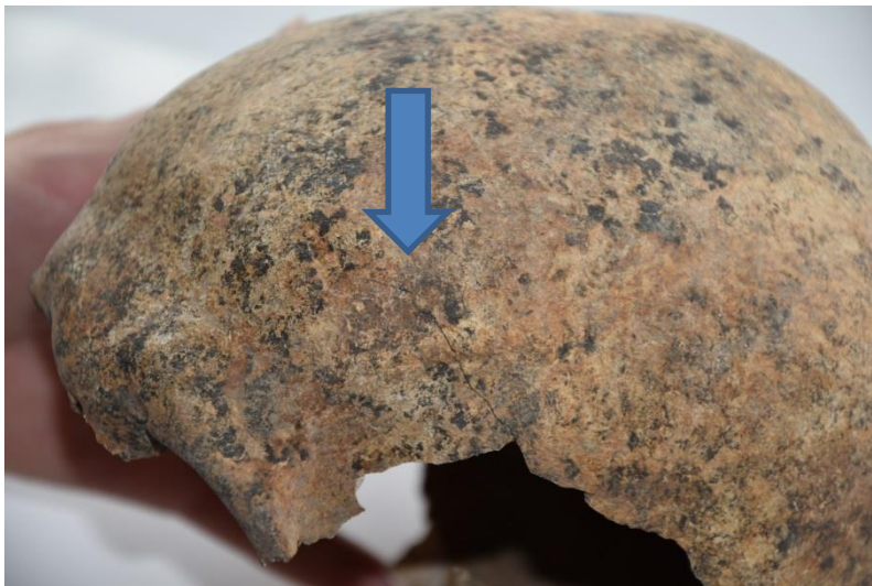
Slika 15. Prikaz antemortalne traume izduženog oblika iznad lijeve očne orbite

Koštani ostaci pripadaju muškarcu čija se dob procjenjuje na 30-39 godina na temelju zubnog statusa i vidljivih osteoartritičnih promjena na zglobnim plohamama. Na čeonj kosti iznad lijeve očne orbite vidljiva je antemortalna trauma izduženog oblika, dimenzija 15 x 4,5 mm nastala najvjerojatnije udarcem tupim predmetom (slika 15).