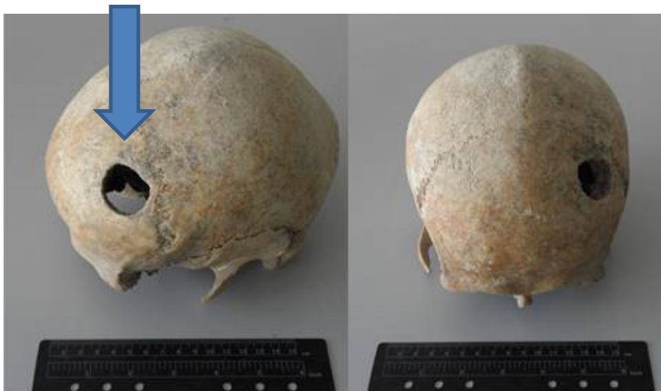
Slika 17. Perimortalna trauma na čeonj kosti nastala trepanacijom

Koštani ostaci pripadaju muškarcu dobi 55-64 godine procijenjene na temelju srastanja šavova lubanje. Spol je procijenjen na temelju morfologije lubanje, naglašenih nadočnih lukova i nuhalnih linija na zatiljnoj kosti. Vidljiva je perimortalna trauma na lijevoj strani čeone kosti uz koronalni šav, nepravilnog kružnog oblika dimenzija 28,2 x 29 mm (Slika 17). Uz rub s unutrašnje strane traume vidljiv je koštani epifit koji je vjerojatno nastao kao dio tumora. Trauma je rezultat trepanacije bušenjem koja je napravljena najvjerojatnije kako bi se olakšali simptomi tumora koji je moguće vidjeti s unutrašnje strane traume.