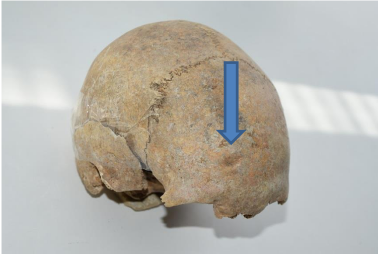
Slika 4. Antemortalna trauma iznad desne orbite

Koštani ostaci najvjerojatnije pripadaju ženskoj osobi čija se dob procjenjuje na 20-24 godine. Procjena se temelji na šavovima lubanje koji još nisu do kraja srasli. Na čeonj kosti, 25 mm iznad desne orbite, nalazi se antemortalna trauma dimenzija 12 x 6,7 mm (Slika 4).