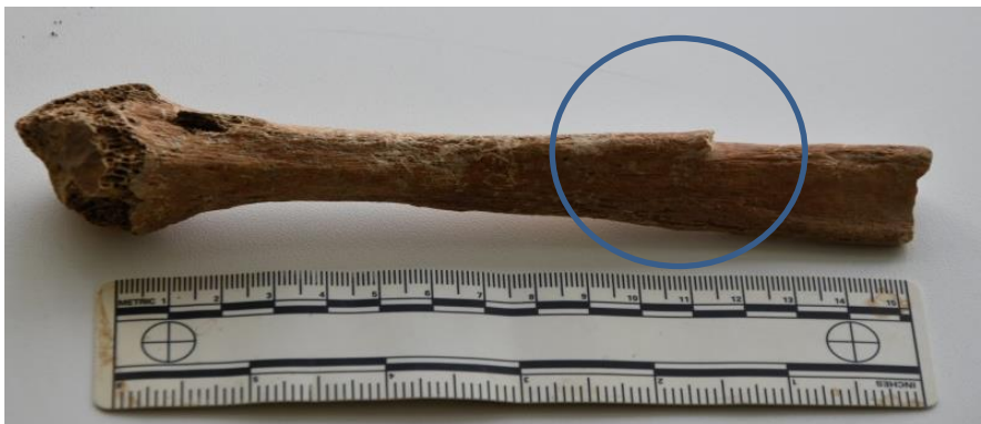
Slika 13. Prikaz kalusa na lisnoj kosti kao posljedica prijeloma

Koštani ostaci najvjerojatnije pripadaju muškarcu čija se dob procjenjuje na 25-30 godina. Procjena se temelji po stupnju sraslosti zglobnih ploha, križne kosti, sraslosti šavova i zubnom statusu. Na distalnoj polovici desne lisne kosti nalazi se koštani kalus, najvjerojatnije nastao prijelomom koji se samostalno zacijelio (slika 13). To koštano zadebljanje znak je antemortalne traume.