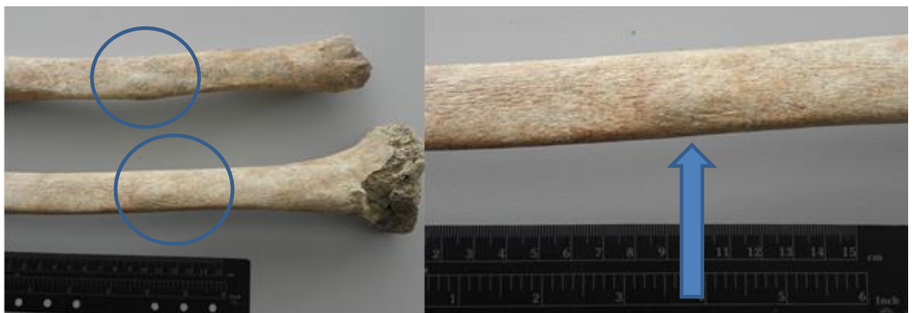
Slika 20. Prikaz ispupčenja na desnoj i lijevoj goljeničnoj kosti kao rezultat antemortalnih trauma nastalih najvjerojatnije udarcem

Koštani ostaci pripadaju muškarcu čija se dob procjenjuje na 20-24 godine na temelju zubnog statusa i stupnja srastanja šavova lubanje. Na goljeničnim kostima vidljive su tri antemortalne traume nastale najvjerojatnije udarcem. Na sredini dijafize desne goljenične kosti vidljiva su dva ispupčenja nastale najvjerojatnije udarcem, ozlijede su sanirane. Ozlijede iste vrste vidljive su na sredini dijafize lijeve goljenične kosti (Slika 20). Nadalje, sve traume su zacijeljene te na mjestima trauma vidljivi su znakovi periostitisa, odnosno upale pokosnice kosti što je tipičan nalaz kod postojanja traume.