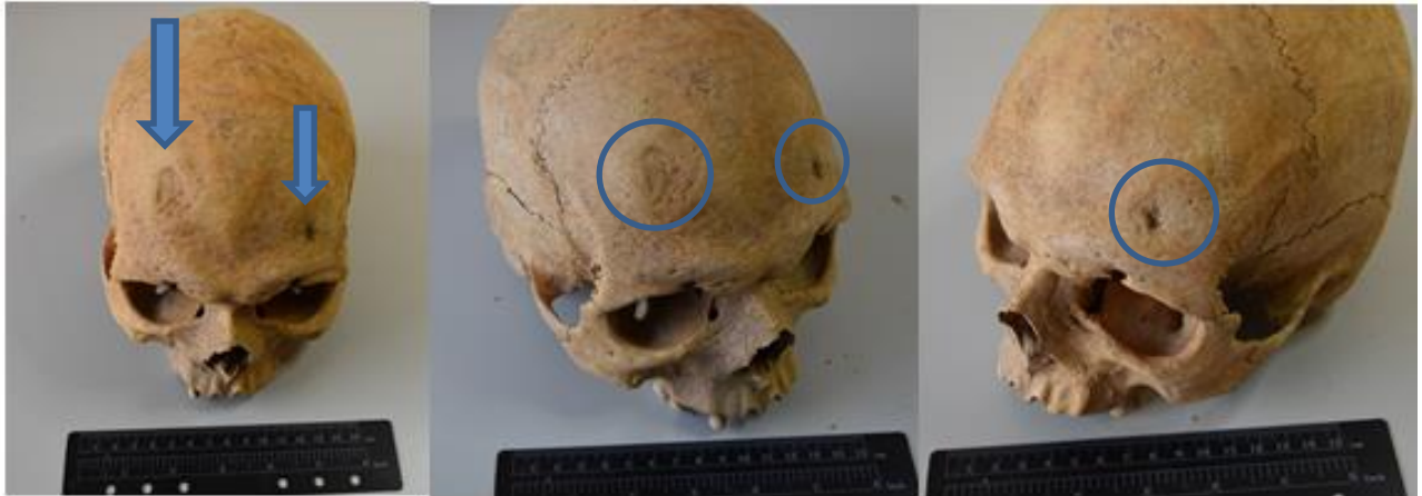
Slika 6. Prikaz dviju antemortalnih trauma na čeonj kosti

Koštani ostaci pripadaju muškoj osobi dobi procijenjene na 25-29 godina. Dob je procijenjena na temelju linija srastanja na vidljivim kostima. Na čeonj kosti vidljive su dvije antemortalne traume, obje nepravilnog kružnog oblika promjera 30 mm i 5 mm (Slika 6). Na nadočnim lukovima vidljive su lezije na kosti koje su najvjerojatnije povezane s ovim traumama. Trauma na čeonj kosti najvjerojatnije je nastala udarcem tupotvrdim predmetom.