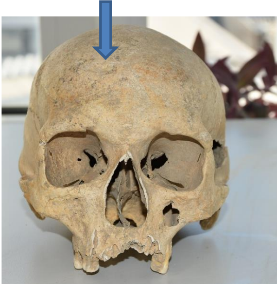
Slika 9. Prikaz antemortalne traume (udubljenje) na čeonj kosti lubanje

Koštani ostaci najvjerojatnije pripadaju muškarcu čija se dob procjenjuje na 50-59 godina, što temeljimo na šavovima i stupnju osteoartritisa. Na čeonj kosti, vidljivo je udubljenje nastalo antemortalnom traumom, dimenzija 15,5 mm (Slika 9).