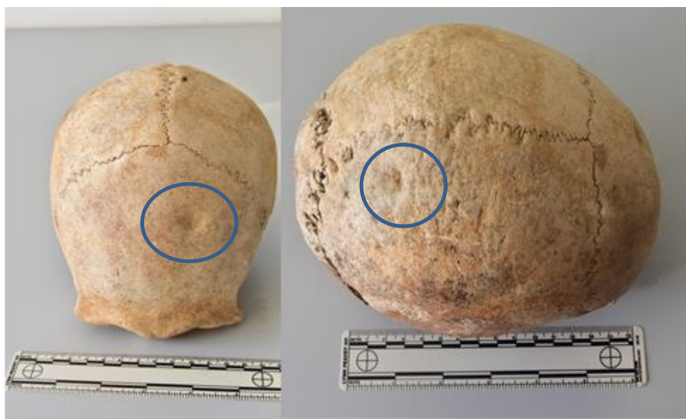
Slika 8. Prikaz dviju antemortalnih trauma na čeonu i tjemenou kosti

Koštani ostaci najvjerojatnije pripadaju muškarcu čija se dob procjenjuje na 40-49 godina na temelju istrošenosti griznih ploha zuba, stupnja srastanja šavova lubanje i znakova početnog osteoartritisa na zglobnim plohamu. Na lubanji su vidljive dvije antemortalne traume nastale najvjerojatnije udarcem tupotvrdim predmetom. Jedna se nalazi na čeonu kosti, kružnog je oblika, promjera 16 mm, druga je na desnoj tjemenou kosti promjera 11 mm (Slika 8).