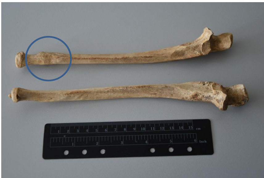
Slika 1. Antemortalna trauma na distalnoj trećini lijeve lakatne kosti

Koštani ostaci pripadaju ženskoj osobi procijenjene dobi 25-34 godine. Na distalnoj trećini lijeve lakatne kosti vidljiva je antemortalna trauma (Slika 1). Kost je potpuno zarasla, te je vidljiv mali koštani kalus.