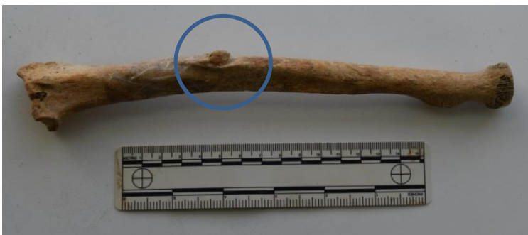
Slika 10. Kalus na lijevoj palčanoj kosti kao posljedica antemortalne traume

Koštani ostaci najvjerojatnije pripadaju muškarcu čija se dob procjenjuje na 40-49 godina na temelju stupnja osteoartritisa, zubnog statusa i šavova lubanje. Na lijevoj palčanoj kosti vidljiva je antemortalna trauma, kalus, koji se smjestio lateralno bliže distalnoj polovici (Slika 10). Uočava se nepravilno srasli prijelom.