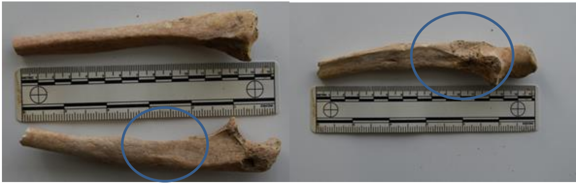
Slika 14. Sanirani prijelom desne lakatne kosti