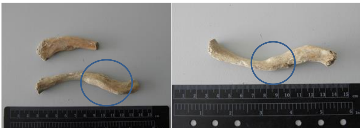
Slika 5. Koštani kalus na lijevoj ključnoj kosti kao posljedica prijeloma

Koštani ostaci pripadaju djetetu čija se dob procjenjuje na 12-15 godina na temelju zubnog statusa i duljine dijafize bedrene kosti (297 mm). Znakovi generaliziranog aktivnog periostitisa vidljivi na svim dugim kostima upućuju na sistemsku infekciju koja je moguće bila uzrok smrti. Na lijevoj ključnoj kosti vidljiv je koštani kalus nastao nakon prijeloma kosti, kost je zarasla, ali nije dobro namještena te je skraćena (Slika 5).