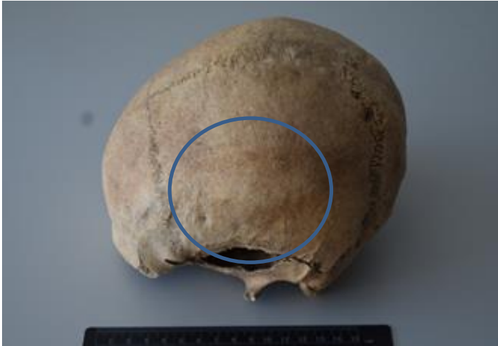
Slika 2. Antemortalna trauma na lijevoj tjemennoj kosti

Koštani ostaci pripadaju muškarcu u dobi 40-49 godina. Na lijevoj tjemennoj kosti vidljiva je antemortalna trauma promjera 10 mm nastala najvjerojatnije udarcem šiljastim predmetom (Slika 2). Oko traume vidljiva je hiperporoznost kosti.