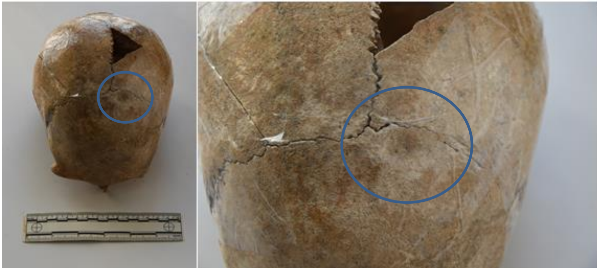
Slika 16. Prikaz antemortalne traume na čeonj kosti