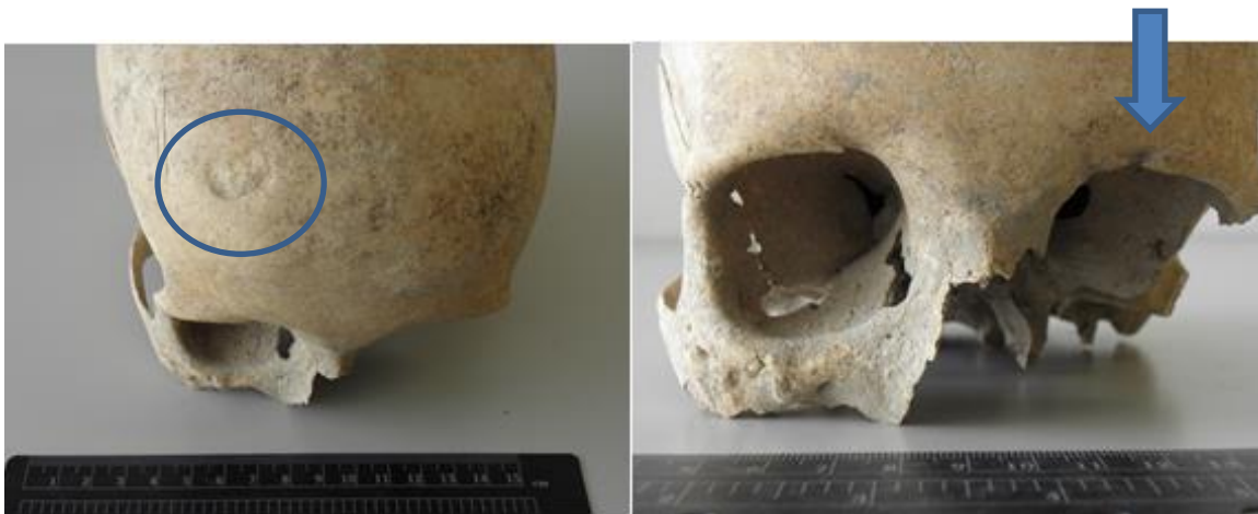
Slika 11. Prikaz dviju antemortalnih trauma na čeonj kosti i lijevoj orbiti

Prisutni koštani ostaci pripadaju ženi čija je dob procijenjena na 45-54 godine na temelju zubnog statusa i srastanja šavova lubanje. Prisutna je vrlo dobro očuvana lubanja, nedostaje lijevi dio lica. Vidljive su dvije antemortalne traume (Slika 11). Prva trauma se nalazi desno na čeonj kosti, nepravilnog je kružnog oblika, dimenzija 17 x 13,5 mm. Na lijevoj strani na rubu orbite je antemortalna trauma, rez duljine 8,1 mm i širine 1,4 mm. Trauma na čeonj kosti nastala je udarcem tupotvrdim predmetom, dok je trauma na gornjem rubu orbite najvjerojatnije nastala slučajnim udarcem.