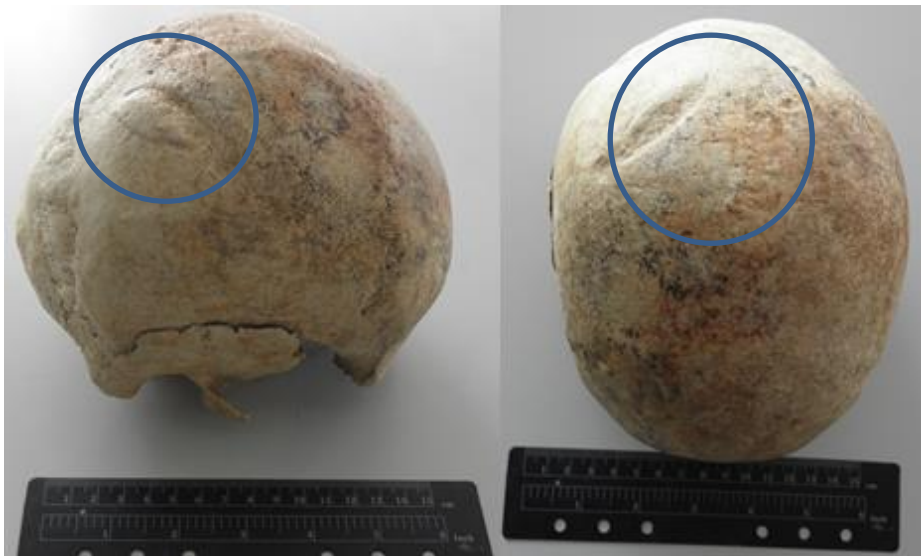
Slika 21. Antemortalna trauma na desnoj tjemenoj kosti

Koštani ostaci najvjerojatnije pripadaju muškarcu čija se dob procjenjuje na 50-59 godina na temelju zubnog statusa i stupnja srastanja šavova lubanje. Na desnoj tjemenoj kosti vidljiva je antemortalna trauma, dimenzija 44 x 18 mm elipsoidnog oblika nastala najvjerojatnije udarcem tupotvrdim predmetom (Slika 21).