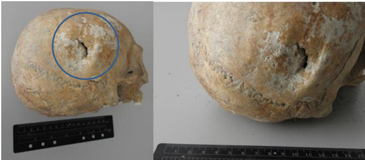
Slika 19. Prikaz antemortalne traume na tjemenoj kosti