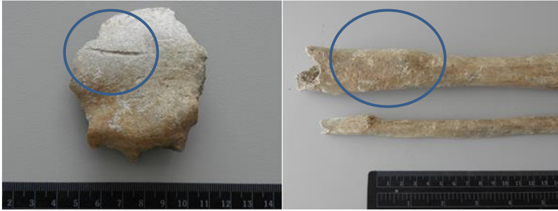
Slika 12. Antemortalne traume na čeonj i lijevoj goljениčnoj kosti