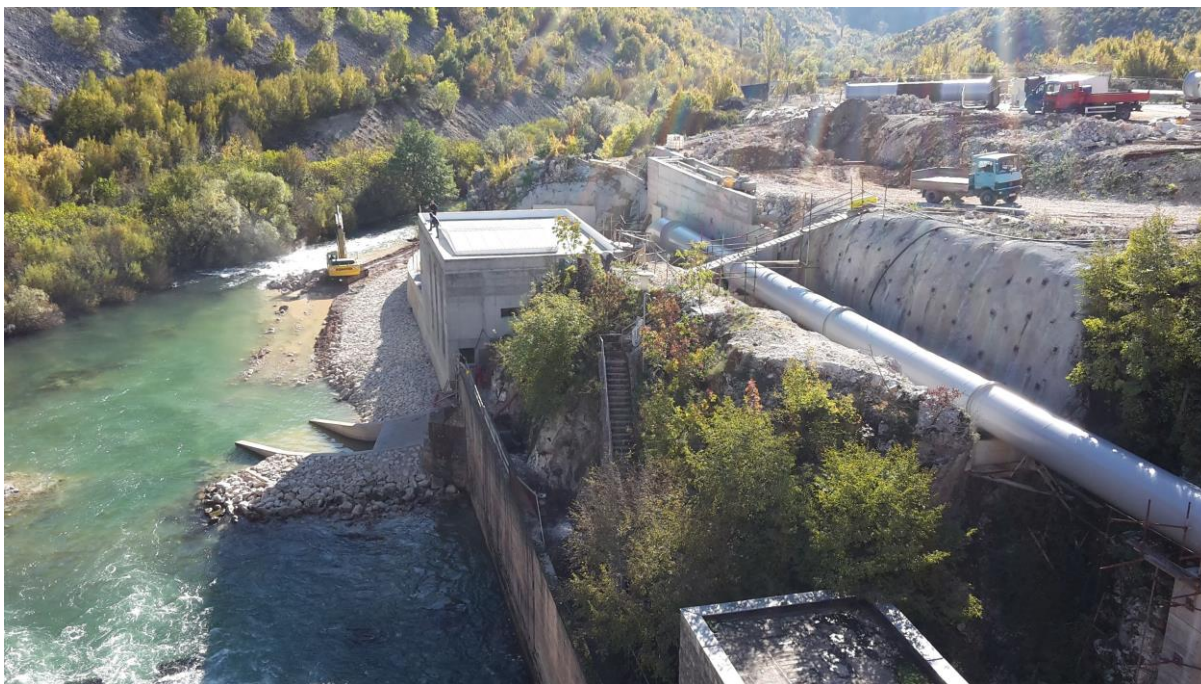
Slika 5. MHE Prančeviči kao primjer investiranja u vlastita energetska postrojenja

S obzirom da energetska sigurnost prodire u sve bitne aspekte funkcioniranja modernih država, pa tako i Republike Hrvatske, ne iznenađuje uvrštavanje energetske sigurnosti u sferu nacionalnog interesa odnosno nacionalne sigurnosti. Sigurnosno obavještajna agencija (SOA) navodi da je energetska sigurnost političko pitanje od nacionalnog interesa pri čemu ističe povoljan geografski položaj Hrvatske koji treba iskoristiti. 5