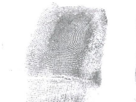
Slika 8. Mješoviti