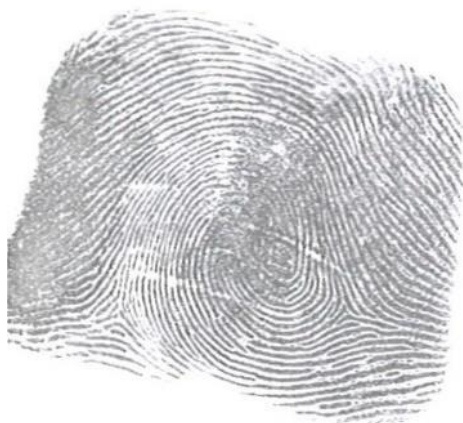
Slika 7. Dvostruka zamka