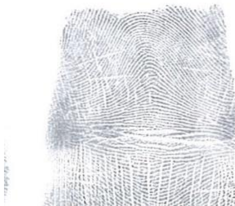
Slika 3. Jednostavan luk