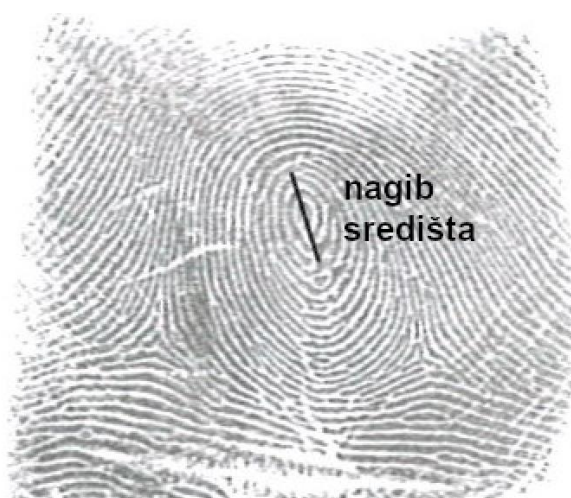
Slika 5. Mjera opažanja nagiba središta kruga