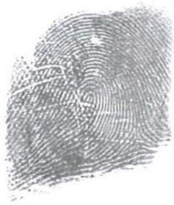
Slika 2. Ulnarna zamka na prstu desne ruke