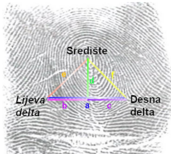
Slika 1. Mjerenja na otisku (a – f)