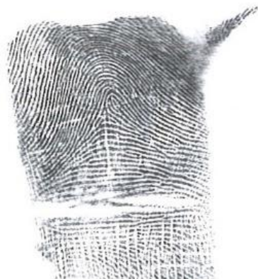
Slika 1. Radijalna zamka na prstu desne ruke