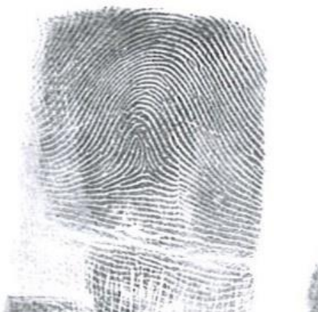
Slika 4. Jelovit luk