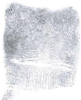
Slika 6. Zamka sa središnjim džepom