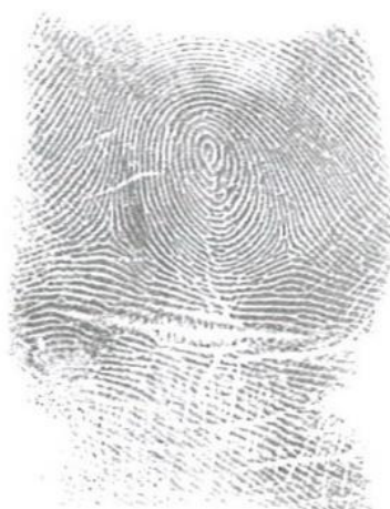
Slika 5. Jednostavan krug