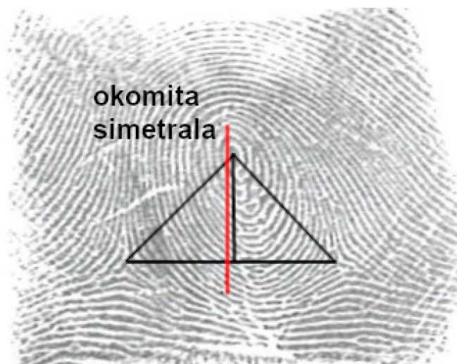
Slika 3. Mjera opažanja okomite simetrale