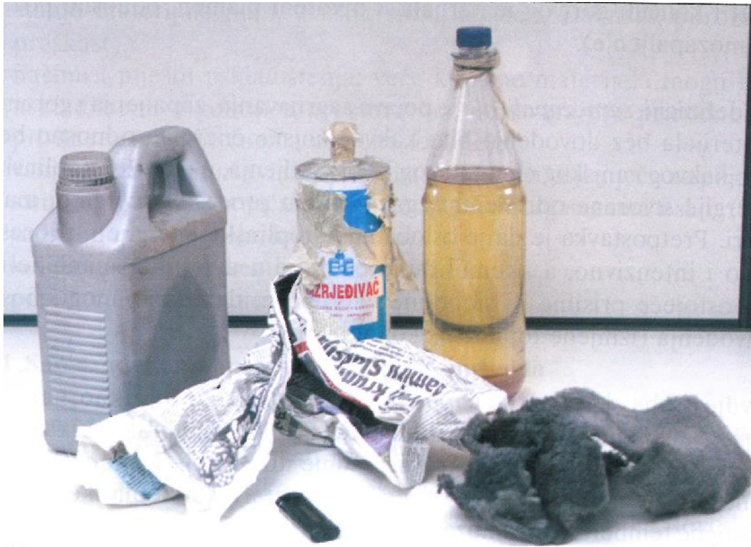
Slika 2. Prikaz najčešćih sredstava za izvedbe paleži, uz dopuštenje autora (6)

Na palež kao mogući uzrok požara može ukazati i način na koji se neki požar razvio i širio kroz prostor. Iz tog razloga je vrlo važno utvrditi ishodište požara, kao i saznati vrijeme nastanka požara. Kada se na opožarenom području nađe više ishodišta požara koji nisu međusobno zavisni, to je jedan od sigurnijih znakova da se radi o požaru koji je namjerno uzrokovan. Ako je požar nakon izbijanja imao veliku brzinu, a materijal koji je njime zahvaćen nema karakteristike brzog gorenja, vjerojatno je riječ o paleži kod koje je počinitelj koristio lakozapaljive tvari i tu je potrebno temeljito proučiti osobine materijala koji se nalazio u opožarenom objektu. Na palež treba sumnjati ako se na mjestu izbijanja požara nalaze karbonizirani ostaci tvari koje se inače ne nalaze na tom mjestu ili ako na mjestu nastanka požara nije utvrđena prisutnost nekakvog izvora topline koji bi mogao zapaliti gorivi materijal (6). Na slici 3. je prikazan slučaj paleži izveden polijevanjem lakozapaljivom tekućinom i njenim pripaljivanjem.