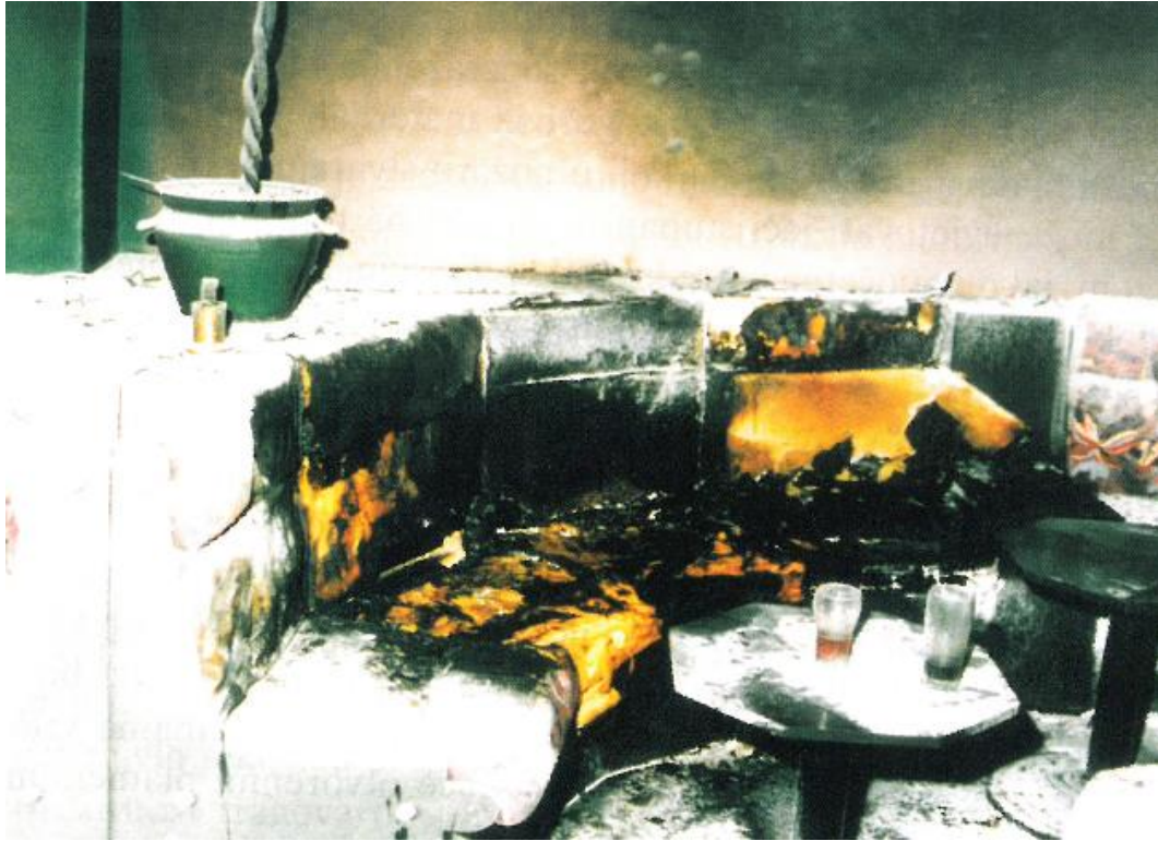
Slika 3. Slučaj paleži izveden i potpomognut korištenjem lakozapaljive tekućine (6)

Kompletna ekipa za očevid treba voditi računa da se tragovi na mjestu događaja moraju očuvati jer njihova rekonstrukcija nije moguća, odnosno uništen trag prestaje biti relevantan. Zbog toga prilikom očevida istražitelji moraju posebnu pozornost obratiti na sve važne tragove koji upućuju na moguću palež, kao što su: