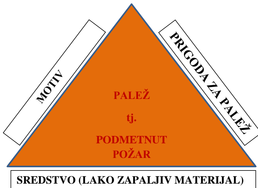
Slika 1. Trokut uvjeta za palež (autor prema 3, 10, 11)