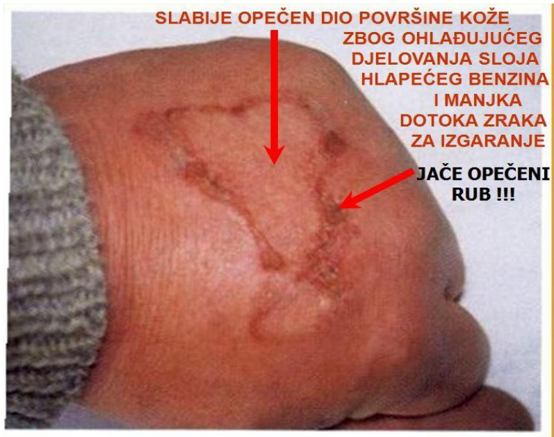
Slika 4. Indicija paleži – trag na počinitelju (11)

Slika 4. prikazuje indiciju djelovanja gorive kapljevine na dijelu tijela osobe za koju se sumnja da je počinitelj paleži.