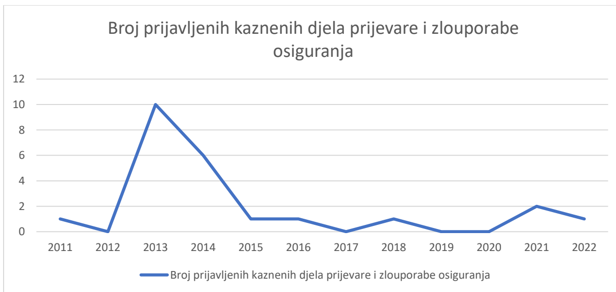
Grafikon 4. Prikaz broja prijavljenih kaznenih dijela na Području PPRP SPLIT PU SD, u period od 2011. do 2022. godine