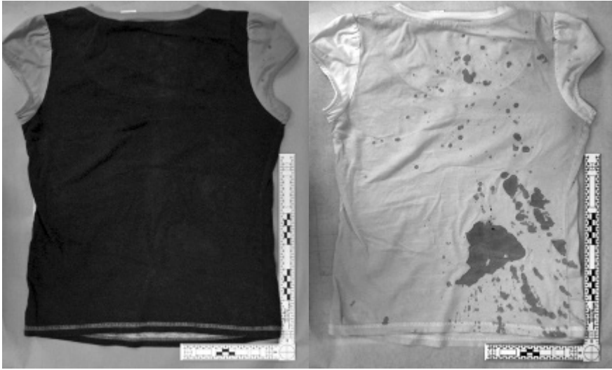
Slika 2: Vizualiziranje tragova krvi na tamnim podlogama – standardna i IC fotografija ( https://www.fujifilmusa.com/products/digital_cameras/x/fujifilm_x_t1_ir/index.html - 15.12.2019.)