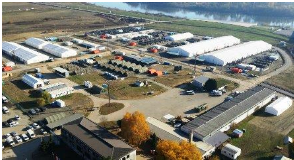
Slika 19. Zimsko-prihvatni-tranzitni kamp za migrante u Slavanskom Brodu

Kamp u Opatovcu bio je u funkciji do 3. studenog 2015. godine kada je uspostavljen koridor za kontrolirani prijevoz emigranata vlakovima iz Šida u Srbiji, preko Slavanskog Broda, do graničnog prijelaza Dobovo u Sloveniji, što je stvorilo preduvjete za otvaranje zimskog prihvatni – tranzitni centar u Slavanskom Brodu (Slika 19.).