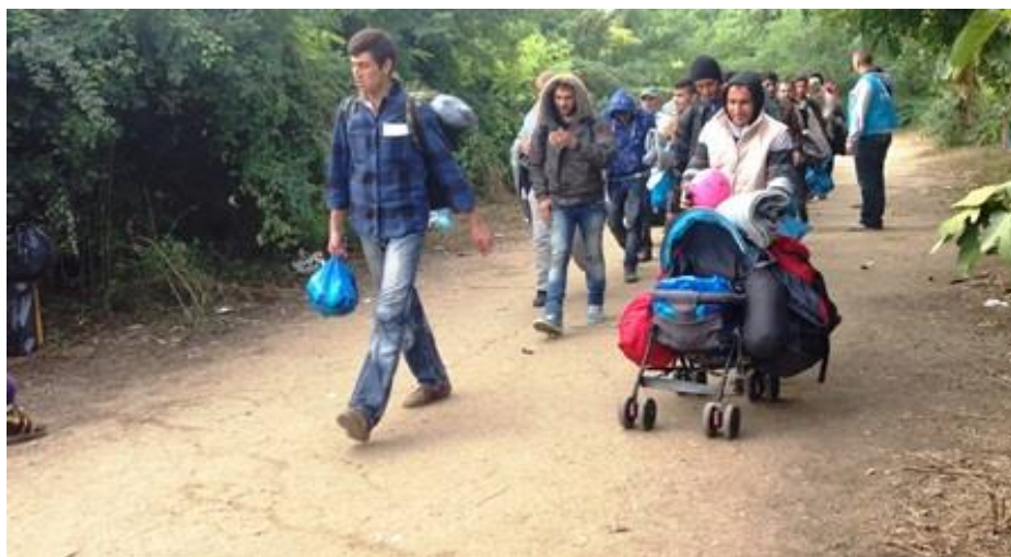
Slika 16. Bapska, ulazak imigranata u Republiku Hrvatsku

Također se 2015.godine u kolovozu stvorio problem u Hrvatskoj zbog zatvaranja mađarske i srpske granice. 1300 emigranata je tad preko RH ušlo u teritorij EU.