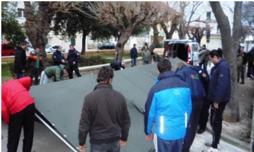
Slika 8. Osposobljavanje povjerenika civilne zaštite grada Vodice

Ako su takve postrojbe nedostatne za nastali događaj na svom području djelovanja, općinskom, gradskom, županijskom, podiže se državna razina da sa svojim snagama pokuša odgovoriti za nastalu situaciju koja je izmakla kontroli, gdje bi se uključile sve državne snage te svi njeni timovi tj. intervencijske postrojbe civilne zaštite sa područja Republike Hrvatske.