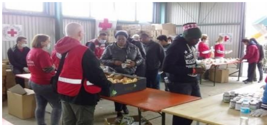
Slika 12. Podjela hrane emigrantima od Crvenog križa u kampu Slavonski Brod

Hrvatski Crveni križ odradio je veliku ulogu kod poplave u Slavoniji točnije 2014. godine kod Županje, Gunje, Rajeva sela, Posavski Podgajci i Đurića kad je popusti nasip kod Rajeva sela pa je poplavio veliki dio navedenih mjesta, uslijed čega je Crveni križ vrlo brzo i učinkovito odradio svoje zadaće kojima je ublažio bol i patnju raznim gestama i aktivnostima u spašavanju stanovništva te kulturnih i materijalnih dobara iz poplavljenih područja županjske Posavine, koja je vodila bitku tjedan dana sa vodom, a sigurno više od mjeseci radilo se na asanaciji terena.