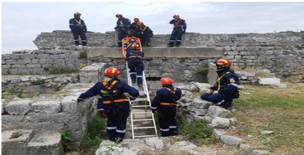
Slika 11. Vježba - spašavanje unesrećenog metodom klizanja preko ljestava, Ugljan-Preko

Tako je već i ove godine održano nekoliko pokaznih vježbi, a jedna od njih je podizanje baze na lokaciji otoka Ugljan mjesto Preko kod tvrđave Sveti Mihovil, gdje je uvježbana samodostatnost s pripadajućom opremom intervencijske postrojbe civilne zaštite (13).