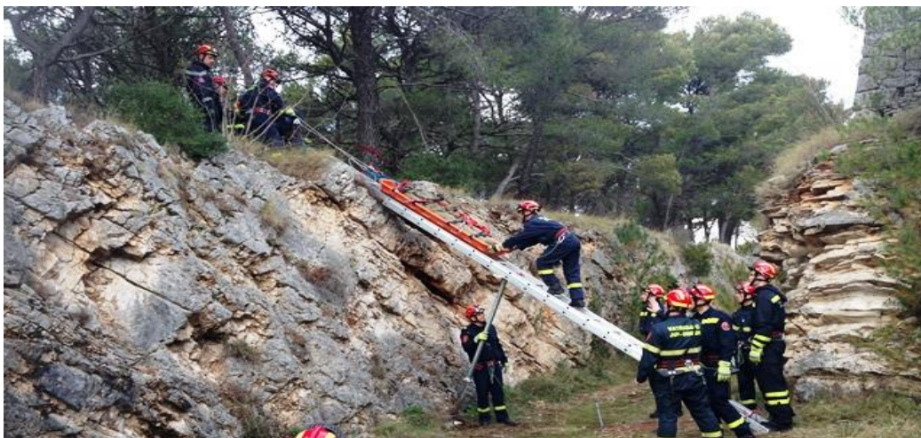
Slika 7. Državna intervencijska postrojba civilne zaštite vježba u Šibeniku,

Tadašnje vodstvo Državne uprave za poslove civilne zaštite je vodilo računa o učinkovitosti postupanja i djelovanja uprave na teritorijalnom načelu koji joj omogućava najbolji pregled i kontrolu područja koji bi mogao naći u ugroženoj zoni (3).