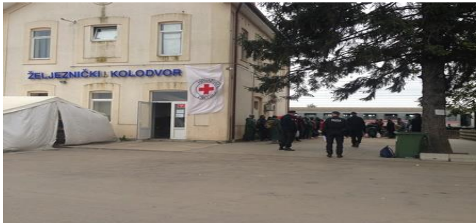
Slika 18. Ukrcaj migranata u vlak, željeznički kolodvor Tovarnik

Ovisno o dinamici dolaska novih emigranata iz Republike Srbije, migranti su nakon kratkotrajnog prihvata u kampu Opatovac prebačeni autobusom na željeznički kolodvor u Tovarnik (Slika 18.) te vlakom odvezeni do hrvatsko-slovenskog graničnog prijelaza.