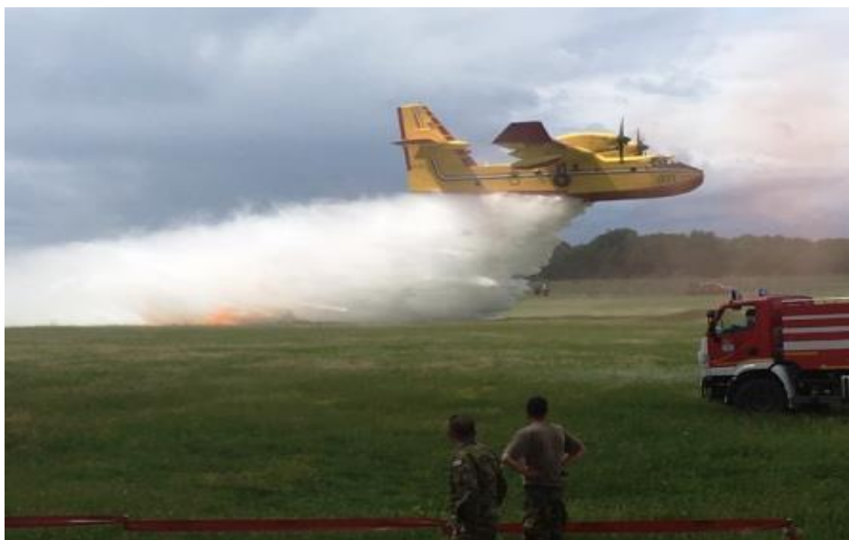
Slika 1. Vježba Sigurnost 2018. Pristeg-Stankovci

Druga tijela koja mogu biti angažirana u okviru sustava domovinske sigurnosti jesu pravne osobe važne za obranu, za zaštitu i spašavanje stanovništva te kulturnih materijalnih dobara, a to su: Hrvatska vatrogasna zajednica (Slika 1.), Hrvatski crveni križ, Hrvatska gorska služba spašavanja, udruge branitelja proizašle iz Domovinskog rata, izviđači, udruge građana, kao i druge pravne osobe koje iz svojih sposobnosti mogu biti važna potpora sustavu domovinske sigurnosti u provedbi aktivnosti i zadaća upravljanja sigurnosnim rizicima u kriznim situacijama koje su od važnosti za nacionalnu sigurnost.