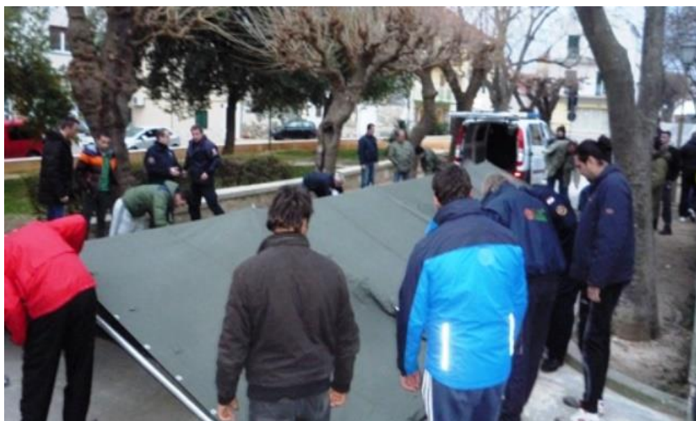
Slika 8. Osposobljavanje povjerenika civilne zaštite grada Vodice

Ako su takve postrojbe nedostatne za nastali događaj na svom području djelovanja, općinskom, gradskom, županijskom, podiže se državna razina da sa svojim snagama pokuša odgovoriti za nastalu situaciju koja je izmakla kontroli, gdje bi se uključile sve državne snage te svi njeni timovi tj. intervencijske postrojbe civilne zaštite sa područja Republike Hrvatske.