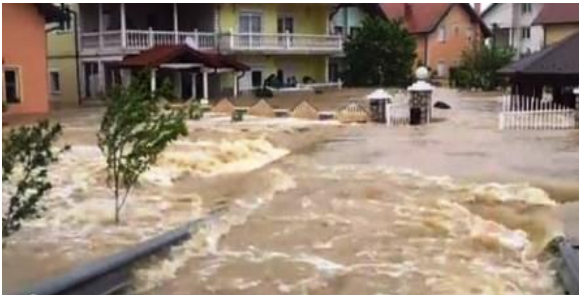
Slika 9. Poplava u Brčkom svibanj 2014. godine

Republika Hrvatska tada je poslala Državnu vatrogasnu intervencijsku postrojbu Republike Hrvatske (Slika 9.), da sa svojim operativnim snagama i opremom koju raspolaže pomogne ugroženom stanovništvu na području Brčkog.