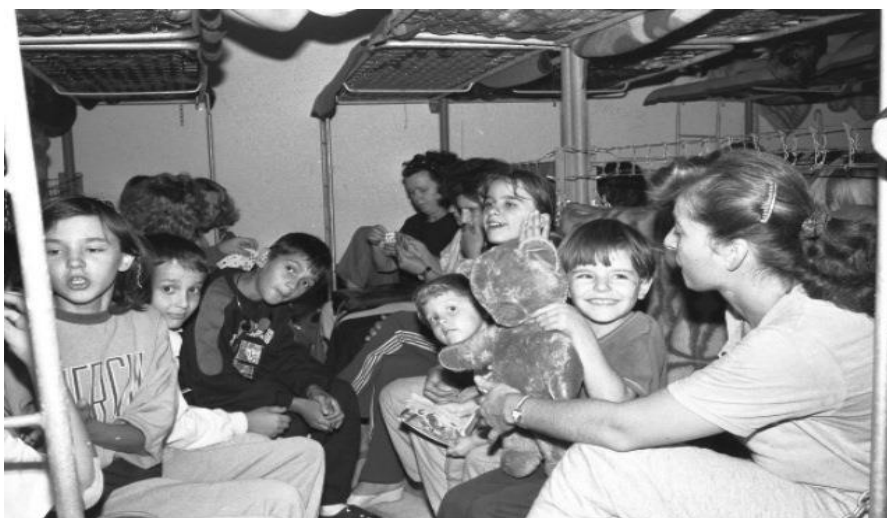
Slika 5. Sklanjanje stanovništva u skloništa prilikom zračnog napada JNA na Zagreb

Tijekom rata u Hrvatskoj je bilo mnogo evakuacija te se može sa sigurnošću reći da su prognanici i izbjeglice evakuirani iz svojih ugroženih mjesta u neka druga sigurnija mjesta, a taj period je počeo već u srpnju i kolovozu 1991. g, a civilna zaštita je bila glavni organizator i provoditelj aktivnosti za evakuaciju, pravila propise, osiguravala prijevoz, dogovarala prihvata i smještaj, brinula o ljudima dok nisu bili zbrinuti na neku sigurniju lokaciju.