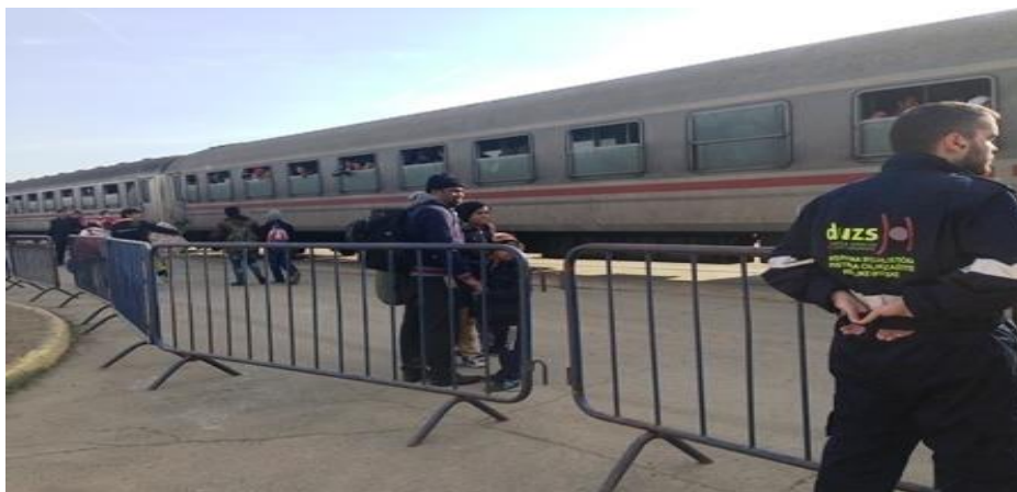
Slika 20. Polazak vlaka s migrantima prema Sloveniji

U svakom sektoru nalaze se grijani šatori s ležajevima, higijensko-sanitarni čvorovi, prostor za pružanje zdravstvene skrbi, prostor za presvlačenje djeca, igraonice za djecu, prostor za podjelu hrane, obuće i odjeće te prostor za molitvu.