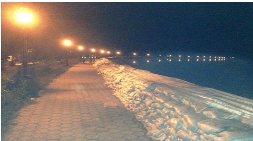
Slika 13. Nasip u Županji rijeka Sava, prilikom najvećeg vodostaja

Visina vodostaja u Županji je dosegla svoj vrhunac i maksimum 17.05. 2014. g. (Slika 13.) kad je visina vodostaja bila 1084 cm te nakon uspješne obrane od poplave u Županji nasipi nizvodno nisu izdržali tako da je došlo do pucanja nasipa u mjestima Rajevo selo i Račinovci.