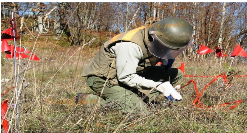
Slika 6. Razminiranje terena od minsko eksplozivnih sredstava

Razminiranje od minsko eksplozivnih sredstava od strane pirotehničara i specijaliziranih postrojbi civilne zaštite provodilo se u mnogim područjima Hrvatske koja su bila okupirana od strane srpskih paravojnih snaga i JNA, a takvi tereni do danas još nisu očišćeni od mina.