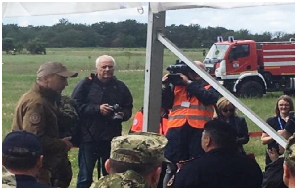
Slika 2. Izlaganje ministar Damira Krstičevića na vježbi Sigurnost 2018. Pristeg-Stankovci

Poduzimanjem učinkovitih Koordinacija za sustav domovinske sigurnosti čine: Vlada Republike Hrvatske prvenstveno zadužena za poslove nacionalne sigurnosti, također kao predsjednik Koordinacije za sustav domovinske sigurnosti, savjetnik predsjednika RH zadužen za nacionalnu sigurnost, čelnici središnjih tijela državne uprave nadležnih za unutarnje poslove, poslove obrane ministar obrane, hrvatske branitelje, civilnu zaštitu, zaštitu okoliša, financije, pravosuđe, zdravstvo, more, načelnik Glavnog stožera Oružanih snaga Republike Hrvatske, glavni ravnatelj policije, glavni vatrogasni zapovjednik, predstojnik Ureda Vijeća za nacionalnu sigurnost, ravnatelj Sigurnosno-obavještajne agencije, ravnatelj Vojne sigurnosno-obavještajne agencije i ravnatelj Zavoda za sigurnost informacijskih sustava (1).