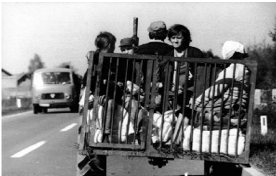
Slika 3. Prognano stanovništvo odlazi iz svojih domova

Uloga civilne zaštite zajedno s drugim službama bila je značajna u angažmanu na zbrinjavanju prognanika i izbjeglica osiguravajući im smještaj, prehranu i odjeću, na način da u područjima Hrvatske koji nisu bili zahvaćeni ratnim djelovanjem srpskih paravojskih formacija i JNA, bile su pripremljene službe za prihvata i smještaj prognanika, ekipe za prvu medicinsku pomoć kao i ekipe za brigu o materijalno-tehničkim potrebama zbrinjavanja (8).