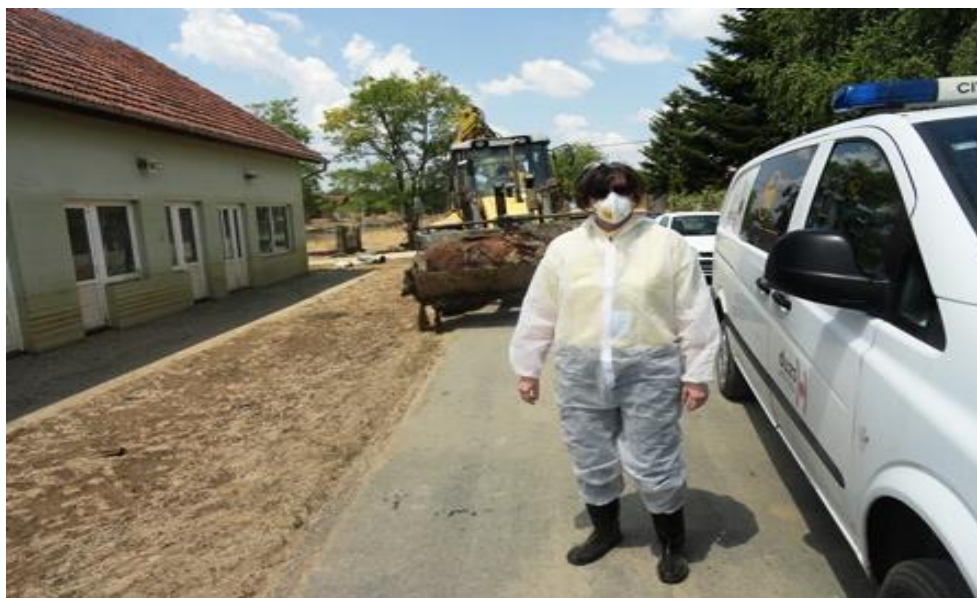
Slika 15. Asanacija terena nakon poplave u županskoj Posavini

Tih dana nitko se nije štedio prema velikom poslu koji je stavljen ispred svih službi civilne zaštite, a posebno rad veterinara koji je bio iscrpljujući, stresan i rizičan zbog ozljeđivanja i emocionalnog sloma, odnosno ugrožavanja svog vlastitog zdravlja.