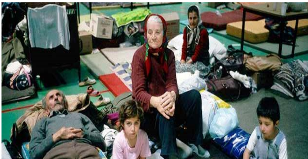
Slika 4. - Smještaj izbjeglica 1991. godine u sportske dvorane

Zbrinjavanje, organiziranu evakuaciju tranzit i prihvata prognanika i izbjeglica bilo je moguće realno riješiti uključivanjem i koordiniranim djelovanjem svih sudionika koji su bili uključeni i odgovorni u provođenju navedenih mjera, tako da možemo konstatirati da je civilna zaštita izvršila svoju koordinativnu zadaću ne baš u lakim uvjetima za rad i djelovanje u tom vremenu.