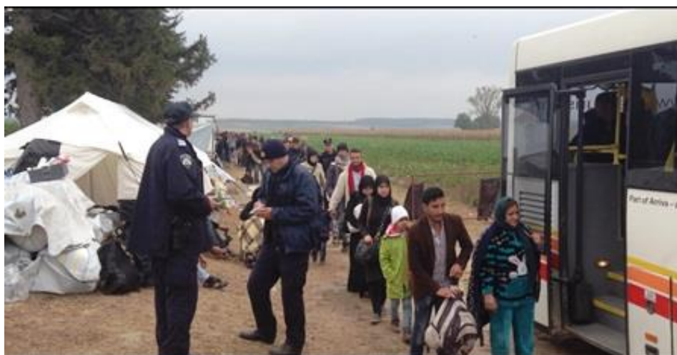
Slika 17. Ulazak emigranata u Tovarnik- preko polja iz područja Republike Srbije

Unatoč velikoj krizi od strane emigranata Vlada Republike Hrvatske je donijela Odluku o osnivanju Stožera za koordinaciju aktivnosti u povodu dolaska emigranata u RH, sukladno navedenoj Odluci za organizacijske i administrativno – tehničke poslove, u ime Stožera zaduženo je Ministarstvo unutarnjih poslova, Državna uprava za zaštitu i spašavanje, Ministarstvo socijalne politike i mladih, Ministarstvo vanjskih poslova, Ministarstvo rada i mirovinskog sustava te Glavni stožer Oružanih snaga Republike Hrvatske Ministarstvo - obrane, a u rad državnog Stožera uključeno je i Ministarstvo zdravlja (17).