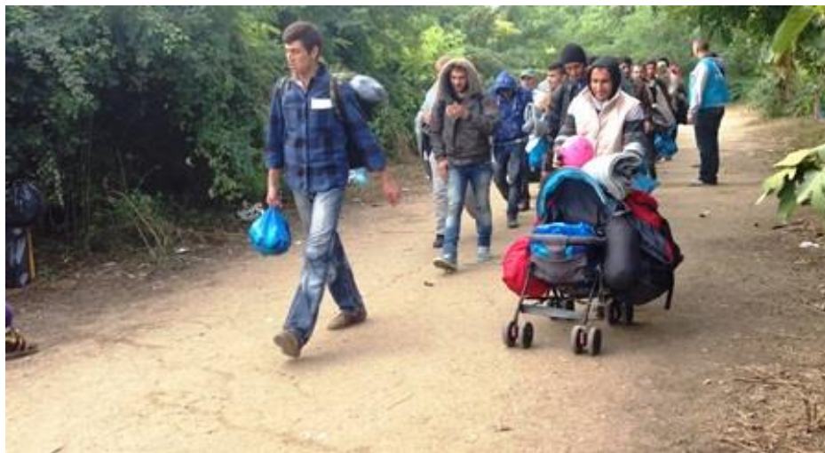
Slika 16. Bapska, ulazak imigranata u Republiku Hrvatsku

Također se 2015.godine u kolovozu stvorio problem u Hrvatskoj zbog zatvaranja mađarske i srpske granice. 1300 emigranata je tad preko RH ušlo u teritorij EU.