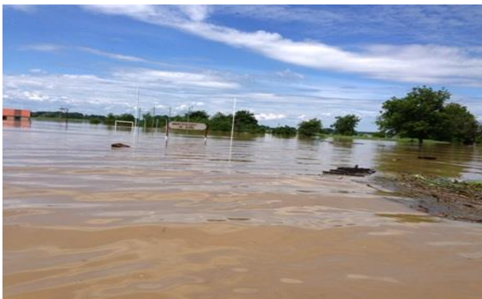
Slika 14. Poplava u županskoj Posavini - Račinovci

Stanovništvo kod prvog udara vode u stambene objekte je moralo brzo krenuti iz svojih domova jer je voda naglo nadirala sa svih strana, a nisu imali vremena za ponijeti osobne stvari sa sobom te su im ostale u prostorima koji su kroz par minuta bili napunjeni vodom.