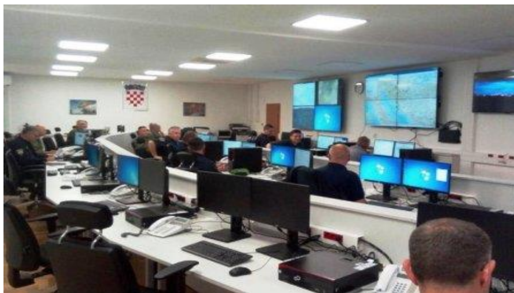
Slika 10. Situacijskom središtu Operativnog centra civilne u Divuljama

Koordinator za suradnju s Ravnateljstvom civilne zaštite prati stanje na terenu i informacije o tome iz raznih izvora, provjerava i usklađuje podatke te osigurava njihovu dostavu Operativnom centru civilne zaštite (14), koji tada priprema potrebna izvješća i predlaže oblike i načine komuniciranja u slučajevima kada se intervencije gašenja požara uključuju zračne snage ili pripadnici Državnih vatrogasnih intervencijskih postrojbi i dodatno angažiranje vatrogasnih snaga u ispomoći (Slika 10.).