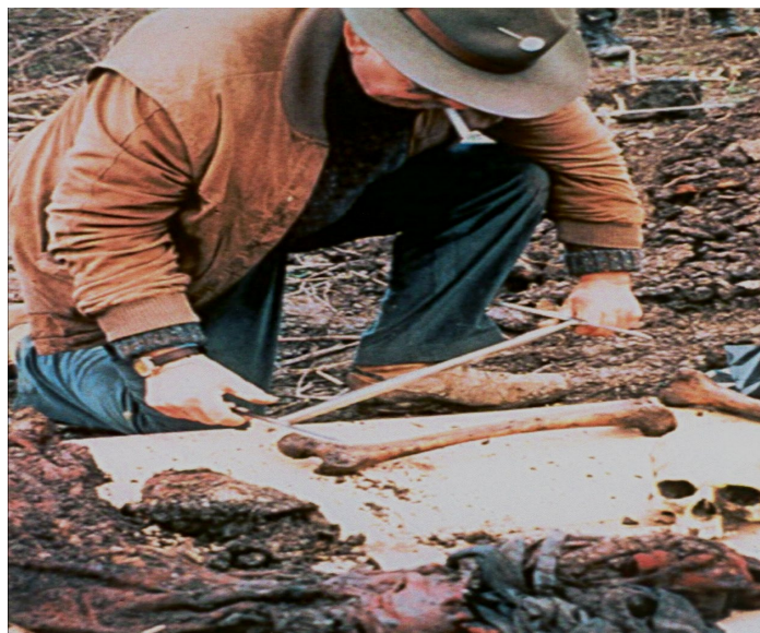
Slika 8. Antropološki pregled dr. Snowa koštanih ostataka pronađenih izvan grobnice.

Pretpostavke dr. Snowa povodom udaljenosti drugog tijela zamijećenog na rubu šume su da je osoba ubijena prilikom bijega, pogubljena nakon zatrpavanja grobnice ili da je riječ o osobi koja se uspjela izvući iz grobnice, a nedugo zatim preminula uslijed teških ozljeda (15).