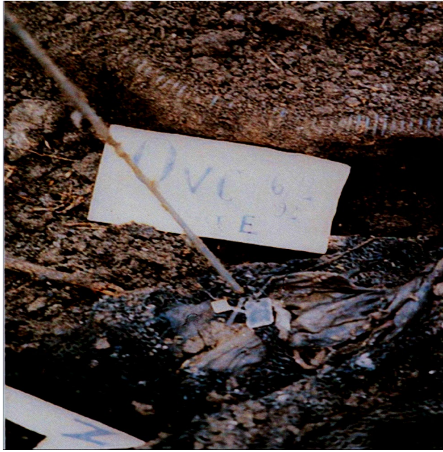
Slika 7. Ogrlica s katoličkim obilježjima pronađena na površini masovne grobnice Ovčara.