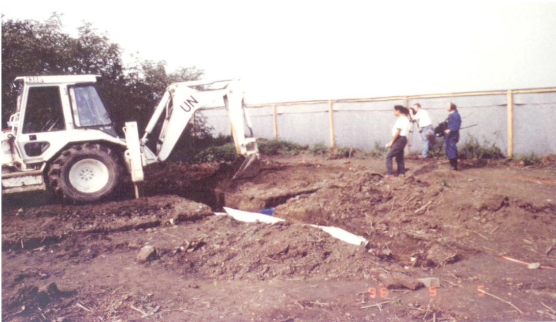
Slika 6. Iskopavanje ispitnog rova na Ovčari.

Vidljivi tragovi djelovanja teških strojeva na sredini grobnice upućivali su da je grobnica pretpostavljene veličine 7×9 m ciljano iskopana. Radi utvrđivanja dimenzija izvorne grobnice i njezinog sadržaja, napravljen je ispitni rov preko površine pretpostavljene masovne grobnice, veličine 1×7 m, dubine 80 cm, u kojoj je otkriveno devet tijela, koja su se dijelom ili cijelim tijelom nalazila u iskopanom rovu, u ležećem isprepletenom položaju bez ikakvog reda, čime je u potpunosti potvrđena izjava svjedoka o počinjenom zločinu na Ovčari. Prvi posmrtni ostaci pronađeni su na dubini od 22 cm, a ostali na početnoj dubini od 60 cm (15,86,87).