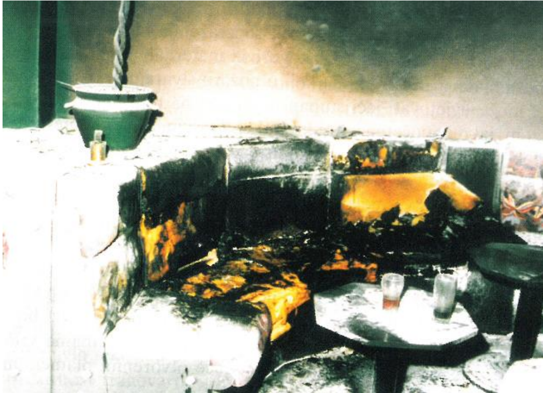
Slika 3. Slučaj paleži izveden i potpomognut korištenjem lakozapaljive tekućine, uz dopuštenje autora (6)

Kompletna ekipa za očevid treba voditi računa da se tragovi na mjestu događaja moraju očuvati jer njihova rekonstrukcija nije moguća, odnosno uništen trag prestaje biti relevantan. Zbog toga prilikom očevida istražitelji moraju posebnu pozornost obratiti na sve važne tragove koji upućuju na moguću palež, kao što su: