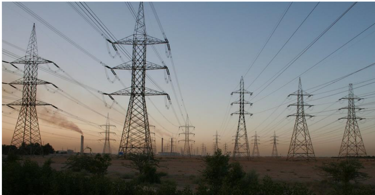
Slika 1. Energetika kao kritična infrastruktura

Ukoliko se osvrnemo u prošlost, vidimo kako se na sigurnost država i društava uglavnom gledalo kroz prizmu vojne sigurnosti, odnosno vojne sile čiji je osnovni zadatak očuvanje sigurnosti od strane vanjskog neprijatelja. Razvijanje vojnih vještina (obrana, napad, ratovanje) su bili dugo vremena prioritet države koji se smatrao jamcem nacionalne sigurnosti, pri čemu su ostali aspekti sigurnosti (ekonomija, kultura, prirodni resursi, politika, ...) u popriličnoj mjeri stavljeni sa strane, odnosno bili zanemarivani. S vremenom se je nacionalna sigurnosna politika mijenjala proširujući svoje vidike, te postepeno obuhvaćala sve veći broj ciljeva i djelatnosti s kojom je se definirao i uspostavljao nacionalni sigurnosni sustav.