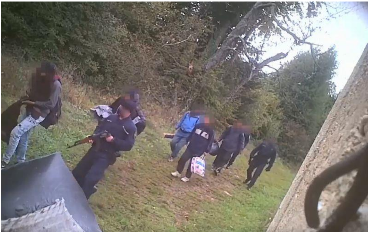
Slika 7. Hrvatske redarstvene snage u sprečavanju ilegalnih prelazaka granice

Suprotstavljanje terorizmu provodi se integriranim pristupom i međuresornom suradnjom, koristeći se mjerama za prevenciju, suzbijanje, zaštitu, te kazneni progon, a sve to uz razne oblike međunarodne suradnje. Do trenutka pristupa šengenskom prostoru. Republika Hrvatska samostalno sudjeluje u čuvanju vanjske granice Europske unije. Zbog kontroliranja navedene granice i migrantskih izazova koji se odvijaju proteklih 5 godina ažuriraju se zakonodavne i operativne mjere u sklopu politika Europske unije.