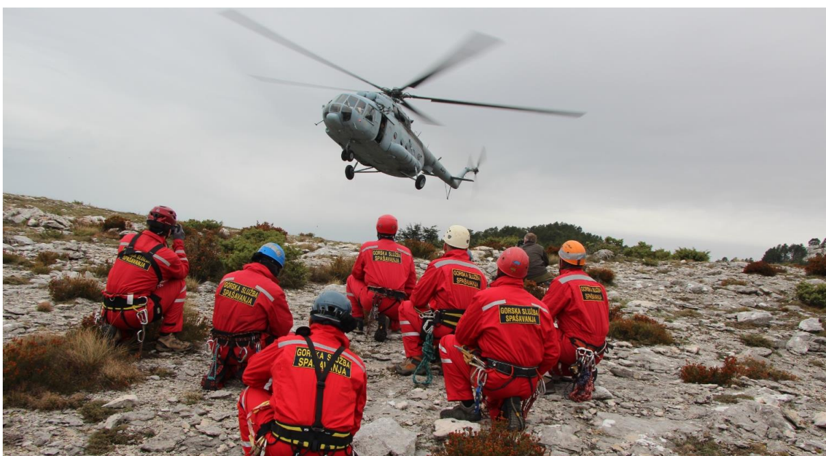
Slika 9. HGSS u akciji