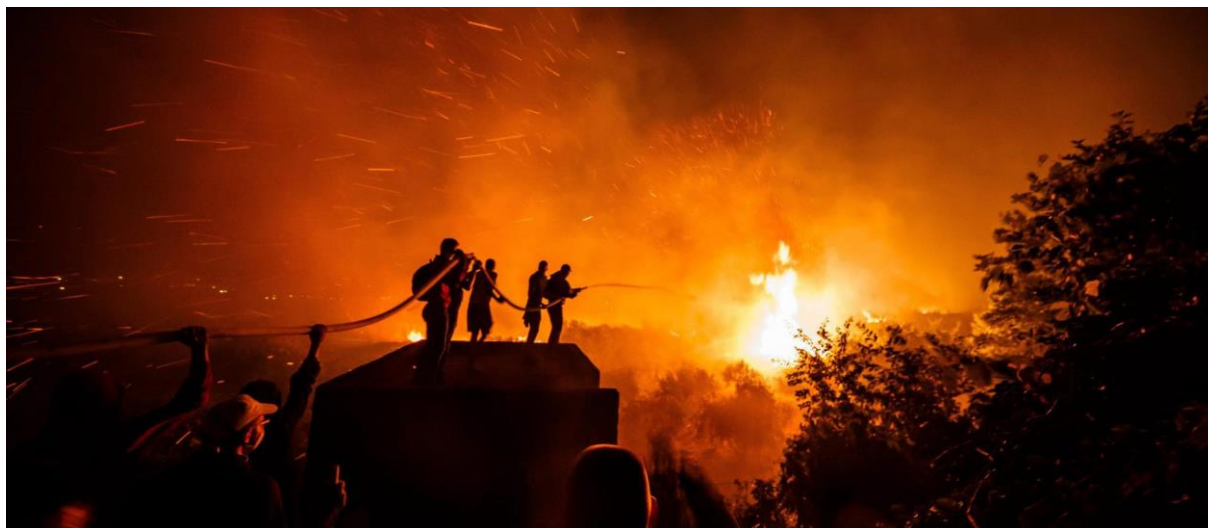
Slika 8. Vatrogasna služba u spašavanju Splita i Žrnovnice