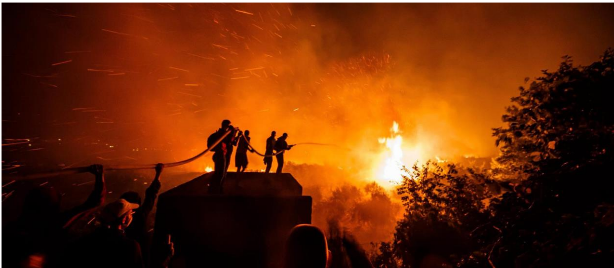
Slika 8. Vatrogasna služba u spašavanju Splita i Žrnovnice