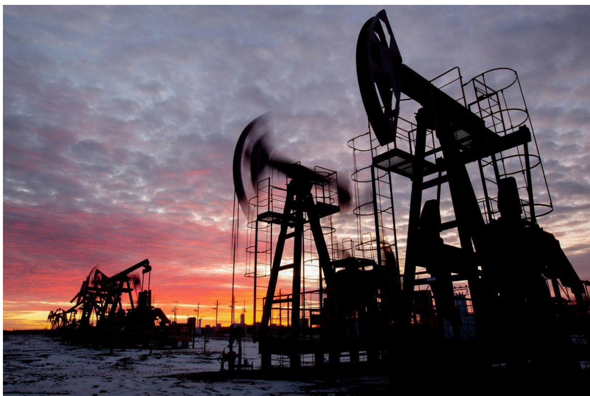
Slika 3. Rusija kao treći proizvođač nafte u svijetu

Poseban utjecaj ovaj sukob koji se najčešće naziva i sukobom istoka i zapada, odnosno Rusije i SAD-a ima na Europski kontinent u cjelini. Razlog tome je uzročno-posljedičnog karaktera, jer ovisnost Europske unije o ruskoj nafti i prirodnom plinu, čini Europu izuzetno izloženom posljedicama ovog sukoba, što proizilazi kao rezultat sankcija EU prema Rusiji i stopiranju isporuke ruskog plina Europskoj uniji. Plin koji dolazi u Europsku uniju iz Rusije zbog rata je minimalan, a EU u kratkom roku ne može naći alternativu za svoje članice i osigurati nesmetanu opskrbu drugim tokovima. Ova situacija direktno utječe na inflaciju, koja se prenosi na nesigurnost i stvara osjećaj panike među stanovništvom. Eventualna dugotrajna visoka inflacija također povećava rizik od društvenih nemira u naprednim i zemljama u razvoju.