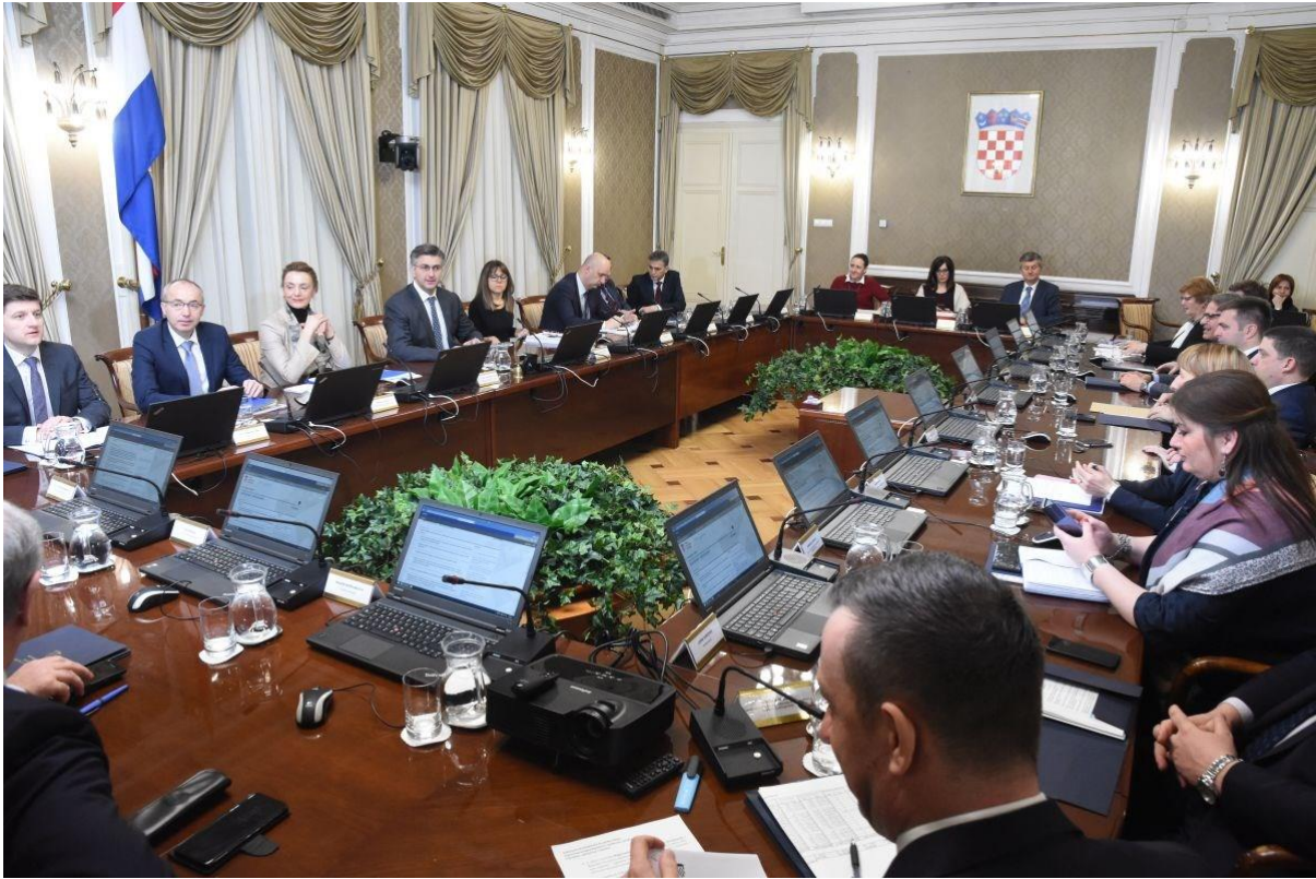
Slika 6. Vlada Republike Hrvatske upućuje Saboru Strategiju nacionalne sigurnosti

politike i instrumenti za ostvarivanje vizije i nacionalnih interesa te postizanje sigurnosnih uvjeta koji će omogućiti uravnotežen i kontinuiran razvoj države i društva. 13