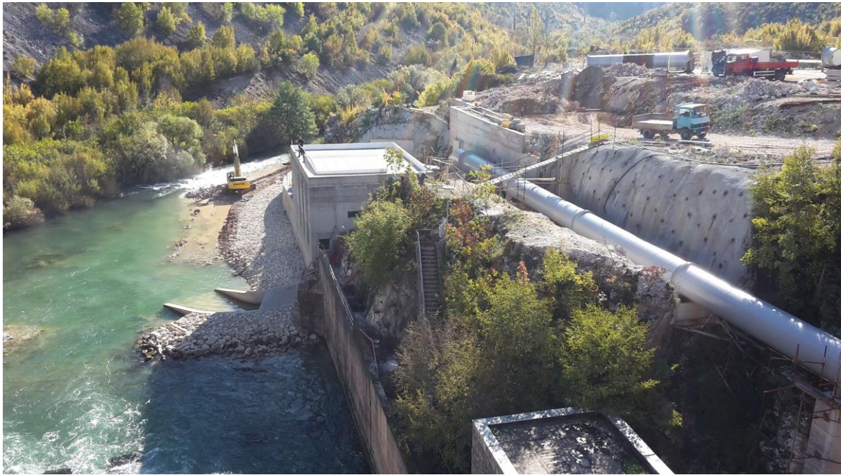
Slika 5. MHE Prančevići kao primjer investiranja u vlastita energetska postrojenja

S obzirom da energetska sigurnost prodire u sve bitne aspekte funkcioniranja modernih država, pa tako i Republike Hrvatske, ne iznenađuje uvrštavanje energetske sigurnosti u sferu nacionalnog interesa odnosno nacionalne sigurnosti. Sigurnosno obavještajna agencija (SOA) navodi da je energetska sigurnost političko pitanje od nacionalnog interesa pri čemu ističe povoljan geografski položaj Hrvatske koji treba iskoristiti. 5