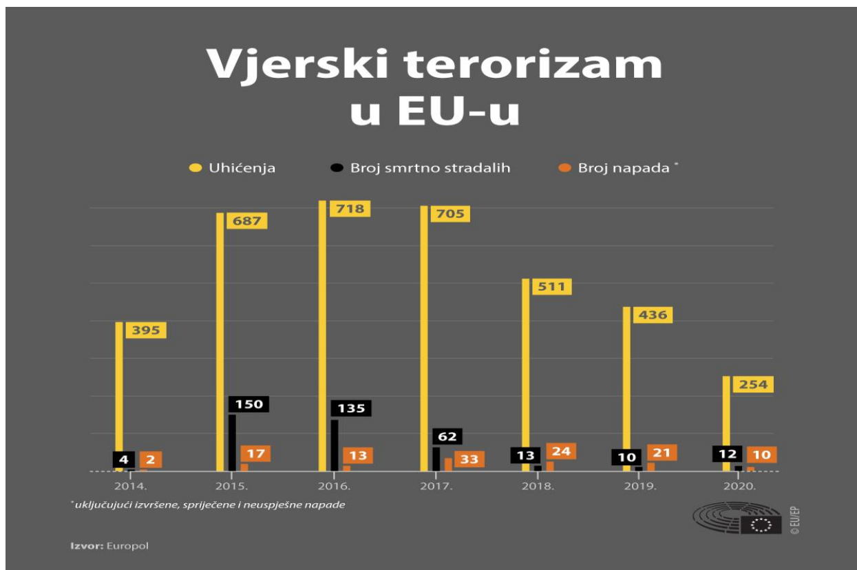
Slika 1. Vjerski terorizam na prostoru EU-a – broj napada, uhićenja i žrtava.