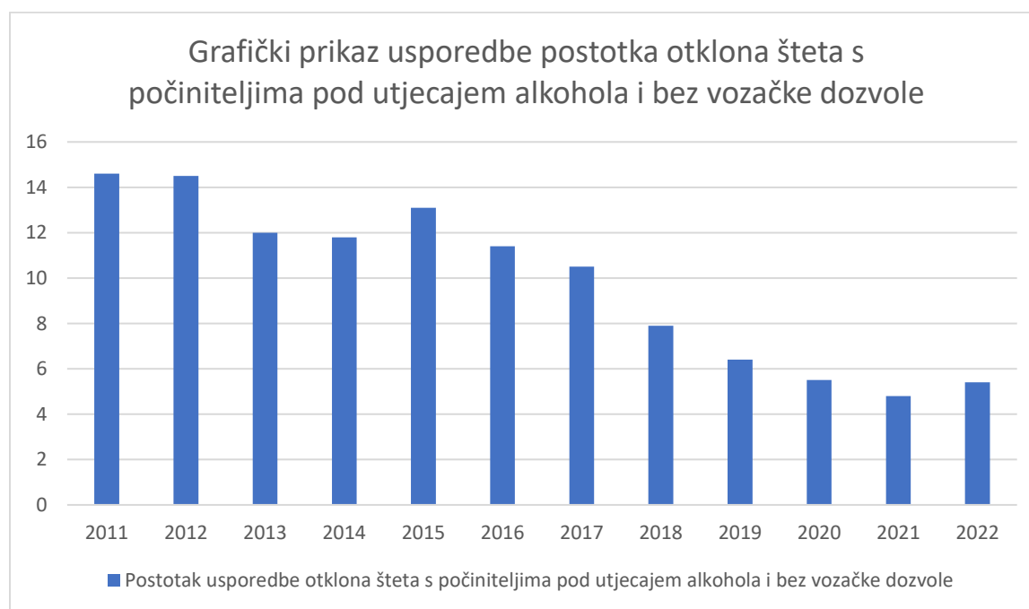
Grafikon 2. Postotak broja počinitelja prometnih nesreća vozača po utjecajem alkohola i bez vozačke dozvole s brojem otklonjenih šteta kod kasko i obveznog osiguranja u period od 2011. godine do 2022. godine.