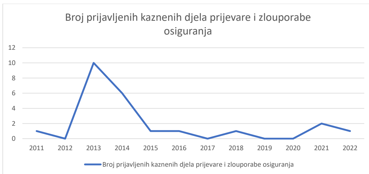
Grafikon 4. Prikaz broja prijavljenih kaznenih dijela na Području PPRP SPLIT PU SD, u period od 2011. do 2022. godine