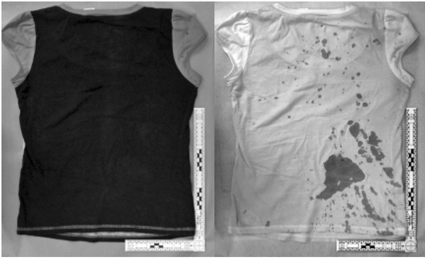
Slika 2: Vizualiziranje tragova krvi na tamnim podlogama – standardna i IC fotografija