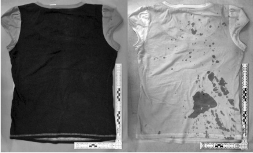
Slika 2: Vizualiziranje tragova krvi na tamnim podlogama – standardna i IC fotografija ( https://www.fujifilmusa.com/products/digital_cameras/x/fujifilm_x_t1_ir/index.html - 15.12.2019.)