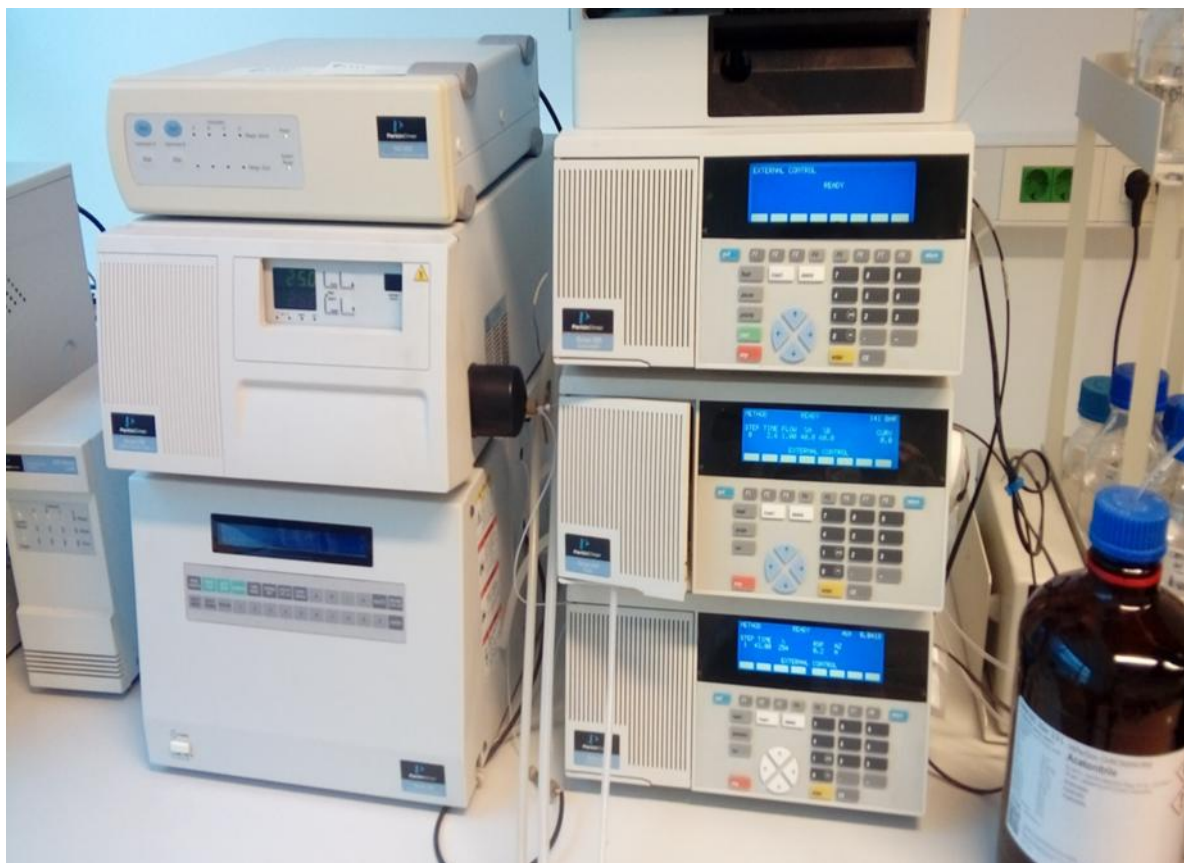
Slika 4. HPLC sustav