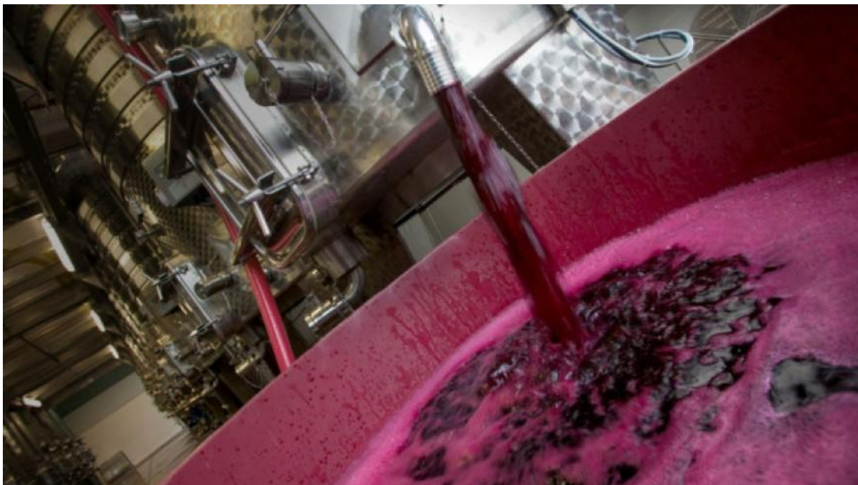
Slika 1. Vino - krajnji produkt proizvodnje (2)