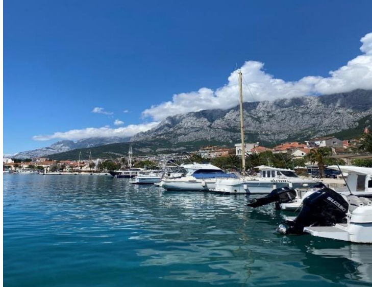
Slika 2 Primjer reda 1a kategorije hidrografskog premjera – luka Makarska ( dubina 4m)