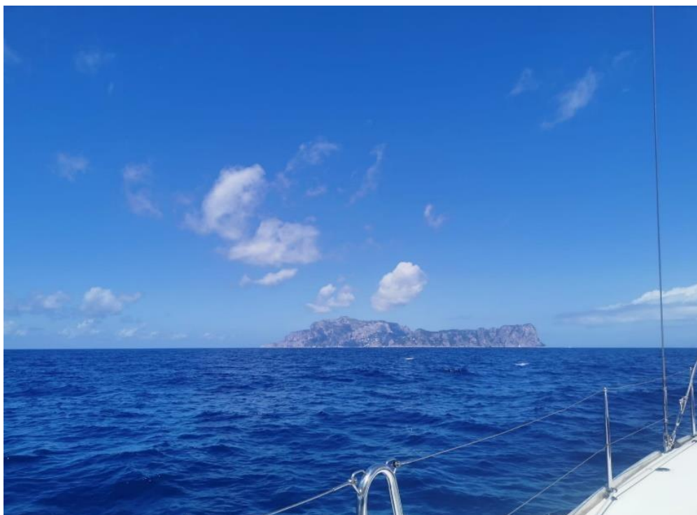
Slika 4 Primjer reda 2 kategorije hidrografskog premjera – obala Italije (Isola di Capri – dubina 220m)