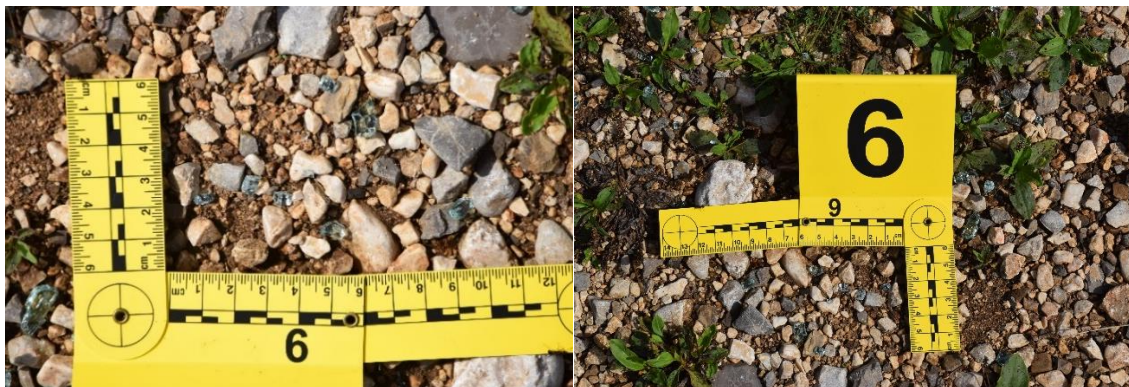
Slika 14. Trag br. 6. – fragmenti stakla