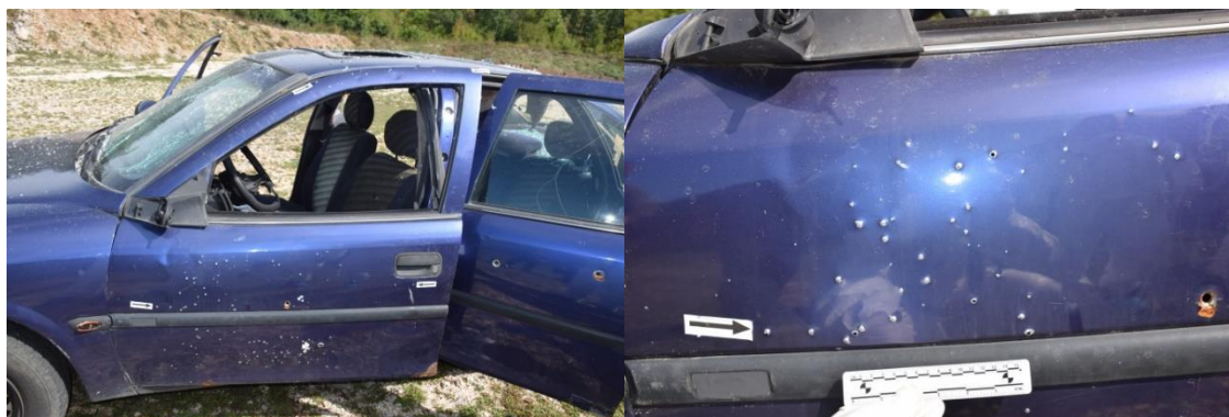
Slika 15. Prikaz oštećenih vrata

Pregledom prednjih lijevih vrata automobila utvrđeno je kako su ista osigurana utvrđivačem koji je zatečen u gornjem, otključanom položaju. Pregledom brave s vanjske strane vrata nisu uočena vidljiva mehanička oštećenja, dok su ona vidljiva na gornjem dijelu krila koji je do širine od 8 cm svježe mehanički oštećen u vidu utisnuća prema van, na udaljenosti od desnog ruba krila do 58 cm. Daljnjim pregledom krila vrata s vanjske strane, u donjem dijelu na površini 60x82 cm uočena su mehanička oštećenja u vidu utisnuća prema van i probijanja metala s vrhovima usmjerenim prema van, pri čemu su nastali otvori veličine do 0,4x0,4 cm (slika 15.).