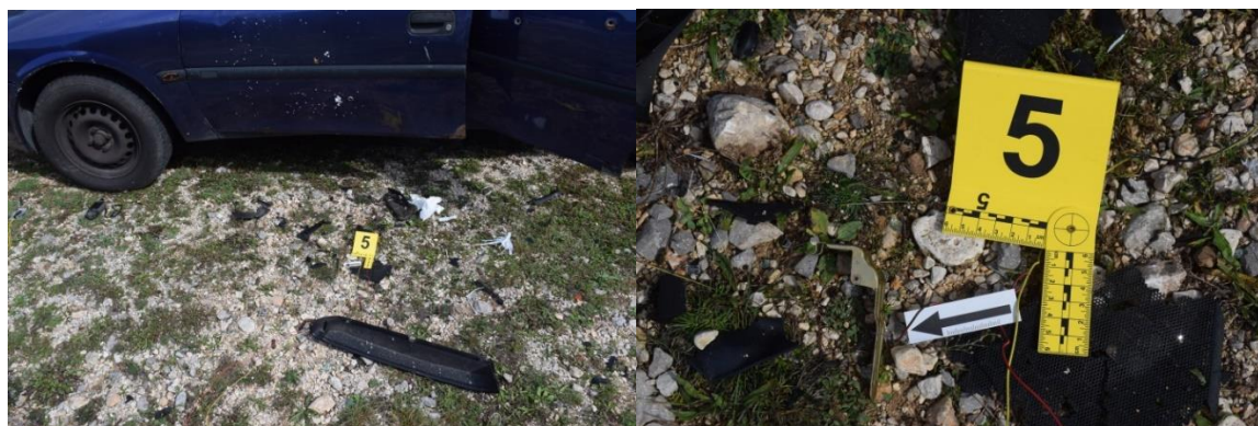
Slika 10. Trag br. 5. – žlica ručne bombe