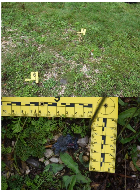
Slika 26. Komad tkanine

Na udaljenosti od 244 cm mjereno od PTM u smjeru juga, a zatim 500 cm mjereno u smjeru istoka pronađen je komad spužve žute boje bez vidljivih tragova oštećenja te s tragovima zacrnjenja ukupne veličine 3x20 cm (fotografirano i označeno kao trag br. 7).