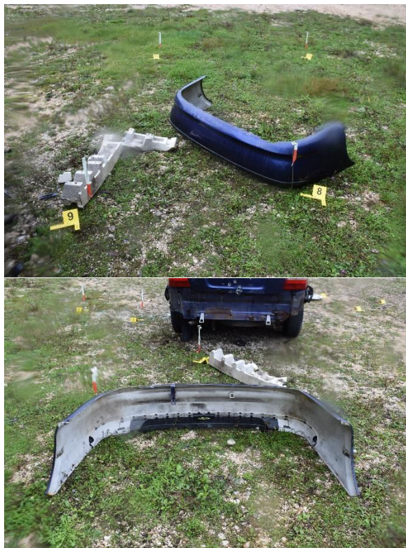
Slika 27. Zadnji branik

Na udaljenosti od 20 cm do 80 cm mjereno od PTM u smjeru sjevera, a zatim na 480 cm mjereno u smjeru istoka pronađena su 2 komada ispune branika od stiropora bijele boje, veličina 20x120 cm i 20x50 cm na čijim rubovima su uočeni mehanička oštećenja u vidu kidanja (fotografirano i označeno kao trag br. 9).