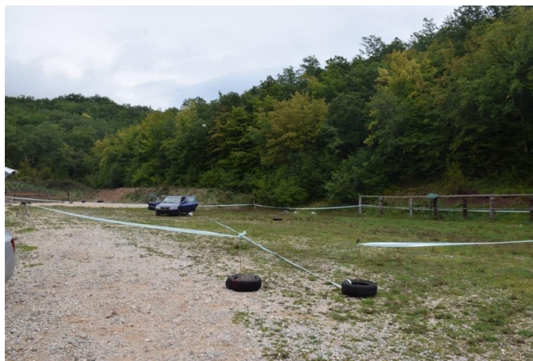
Slika 3. Osiguranje mjesta događaja i obilježavanje "sigurnog puta"

Dolaskom istražitelja kriminalističke Vojne policije u 09:00 sati započinje očevid na mjestu događaja na način da se uzimaju podaci od pripadnika vojne policije koji su prvi došli na mjesto događaja te se provjerava da li je mjesto događaja na neki način izmijenjeno, što se u ovom slučaju nije dogodilo, već je ograđeno i osigurano vojno policijskom trakom.