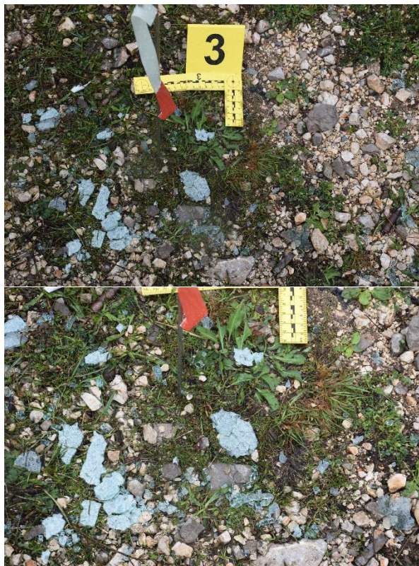
Slika 24. Fragmenti stakla

Na udaljenosti 33 cm mjereno od PTM u smjeru sjevera, a zatim 161 cm u smjeru istoka na površini promjera 54 cm uočeni su tragovi zacrnjenja na šljunčanoj podlozi te udubljenje dubine oko 3 cm (fotografirano i označeno kao trag br. 4). Sa navedenog kratera izuzet je uzorak kratera, na način da je kriminalistički tehničar pomoću lopatice i metlice, preko kojih je bila navučena vrećica, metanjem izuzeo navedeni uzorak i pakirao u staklenku i zatim u dvije vrećice i papirnati KT omot označen kao omot 2. Prije navedenog izuzimanja uzorka kratera kriminalistički tehničar je zaštitio ruke gumenim rukavicama s kojih je uzeo kontrolni bris na trakicu za uzorkovanje eksploziva, te je navedena trakica pakirana u papirnati omot i zatim u plastični omot označen kao omot 2A, nakon čega je izuzet i kontrolni bris s plastične vrećice koja se nalazila na lopatici i metlici te je bris pakiran u papirnati KT omot i zatim u plastični omot označen kao omot 2B, a rukavice su nakon korištenja pakirane u papirnati KT omot 2C).