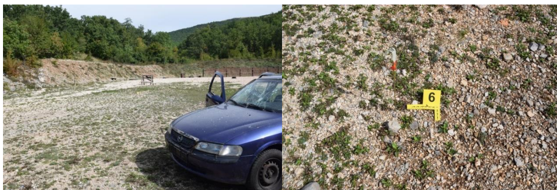
Slika 13. Trag br. 6. – metalne kuglice

Daljnijim pregledom okoline automobila u pravcu sjevera, do udaljenosti od PTM 11,07 m, a potom do 4,63 m u pravcu istoka te do 2,30 m u pravcu zapada pronađeno je više fragmenata razbijenog stakla veličine do 13x7x0,5 cm, koji su oštećeni u vidu zrnatog loma stakla (označeno rednim brojem 6, slika 14.). Pronađeni fragmenti stakla upućuju da su nastali prilikom probijanja metalnih kuglica prednjeg vjetrobranskog stakla prilikom čega je došlo do rasprskavanja dijela vjetrobranskog stakla i odbacivanja fragmenata stakla od vozila.