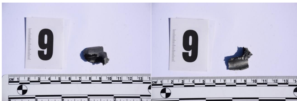
Slika 19. Traga br. 9 – fragmenti metala

Pregledom stražnjih lijevih vrata na istima nisu uočena vidljiva svježa mehanička oštećenja, kako s vanjske tako i s unutarnje strane, kao i na stražnjim desnim vratima. Pregledom stražnjih vrata, utvrđivači su zatečeni u gornjem, otključanom položaju.