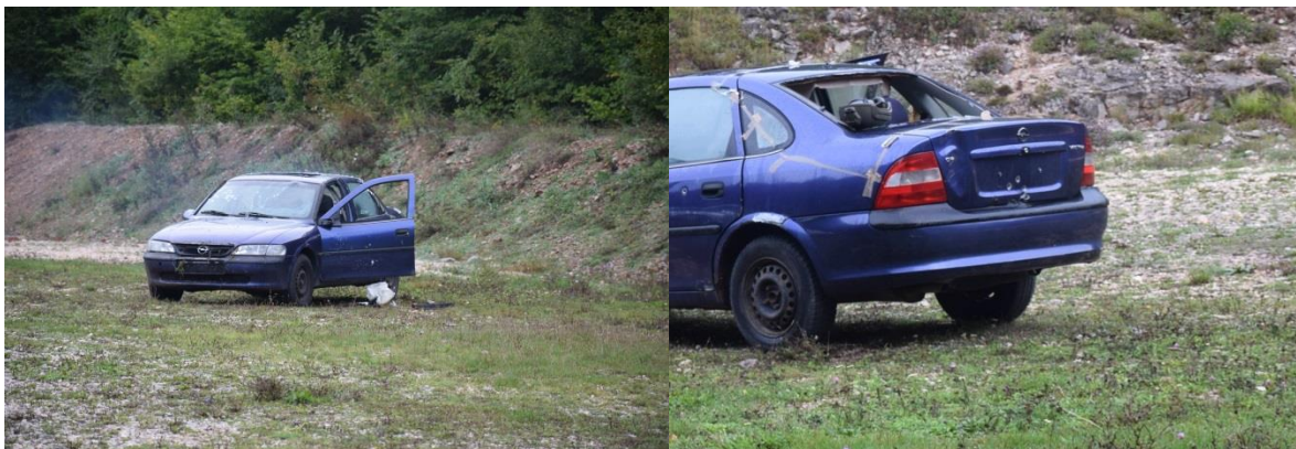
Slika 5. Prednja i stražnja strana vozila