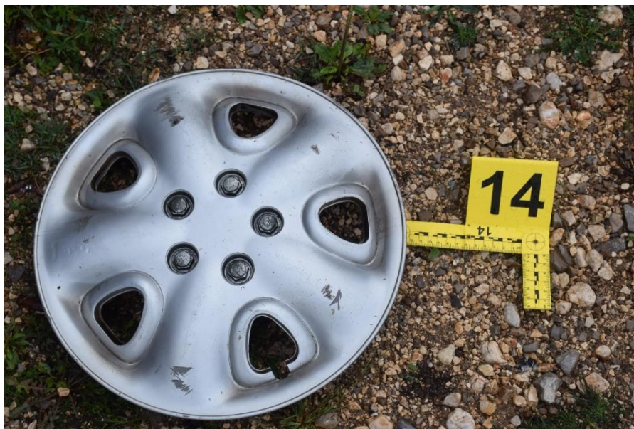
Slika 28. Plastični naplatak

Na udaljenosti od 220 cm od PTM u smjeru sjevera, a zatim 48 cm u smjeru istoka pronađen je ukrasni plastični naplatak prednjeg desnog kotača automobila promjera 50 cm bez vidljivih znakova oštećenja (fotografirano i označeno kao trag br. 14).