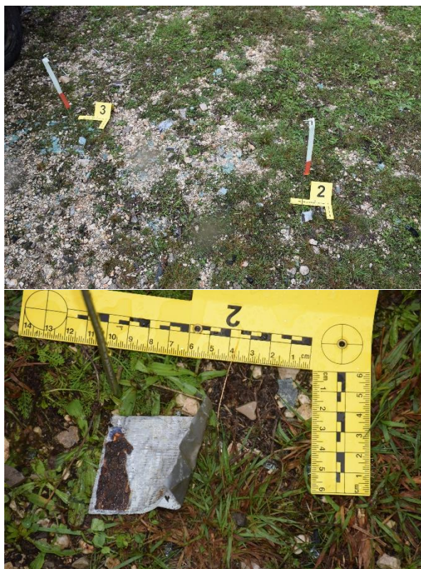
Slika 23. Samoljepiva traka

U nalogu za vještačenje pitanje vještaku kod DNA analize glasi: Nalaze li se na dostavljenom (predmetu/omot br.1) biološki tragovi humanog podrijetla, te ukoliko se nalaze, izvršiti analizu DNA i rezultat usporediti s DNA profilima pohranjenim u bazi podataka DNA profila Centra. U nalogu za vještačenje daktiloskopske pretrage glasi: „Molimo da se poduzme odgovarajuća daktiloskopska pretraga dostavljenog predmeta u cilju pronalaska upotrebljivih spornih tragova papilarnih linija te ukoliko se pronađu, da se provjere putem AFIS-a“.