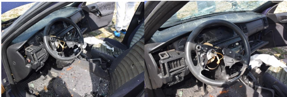
Slika 20. Centar eksplozije

polomljene plastike. Na prednjoj armaturi, u dijelu bliže vozačevih vrata uočeno je odvajanje dijela s ventilacijom i prekidačem rasvjete koja je djelomično izvan ležišta, dok je na upravljaču, koji je bio u otključanom položaju uočeni tragovi trganja obloge te nedostatak središnjeg dijela, a na čijim dijelovima su uočeni tragovi loma metala. Na kolu upravljača su uočeni tragovi savijanja metalnog dijela rukohvata volana (slika 20.).