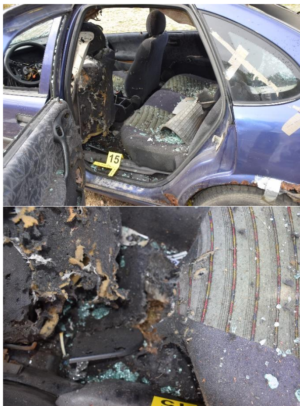
Slika 30. Podna obloga automobila

S rubova nastalog otvora na trakicu za uzorkovanje eksploziva izuzet je bris i pakiran u papirnati KT i zatim u plastični omot označen kao KT omot 4, a prije izuzimanja navedenog brisa s rukavica kriminalističkog tehničara izuzet je kontrolni bris na trakicu za uzorkovanje eksploziva, koji je pakiran u papirnati omot i zatim u plastični omot označen kao KT omot 4A, a rukavice su nakon korištenja pakirane u papirnati KT omot 4B.