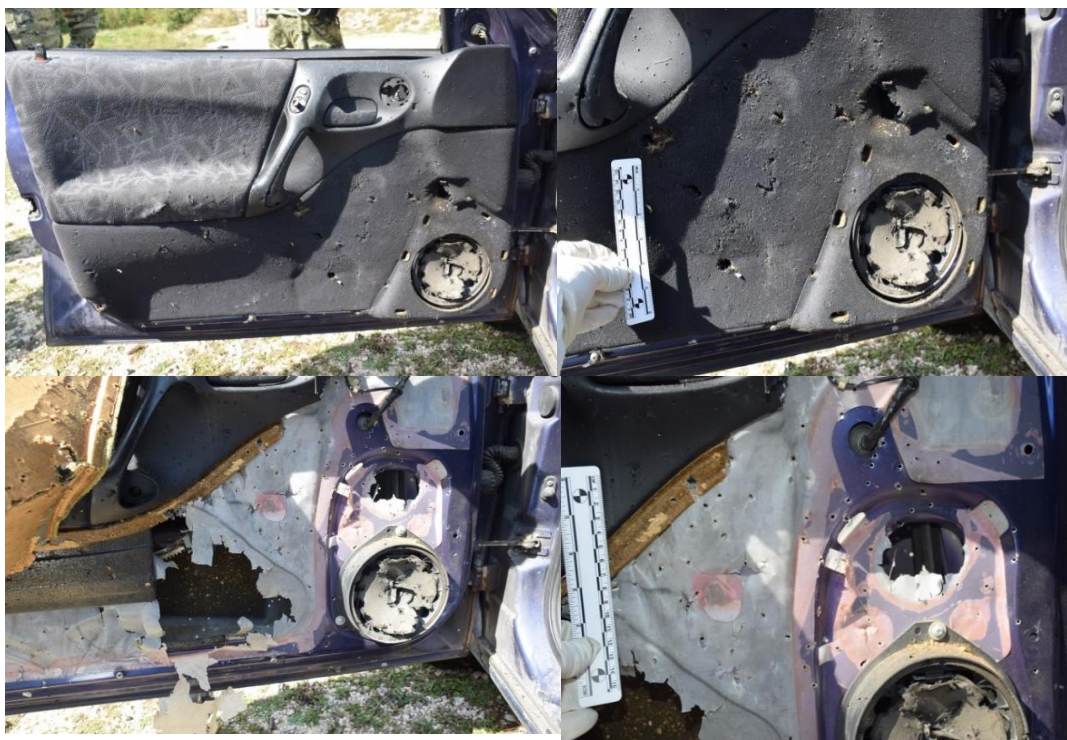
Slika 17. Unutrašnja strana vozačevih vrata

Na karoseriji automobila, uz rub predviđen za zatvaranje vozačevih vrata, nalazila se gumena brtva, a do koje je prema unutrašnjosti ugrađena plastična obloga praga. Na gumenoj brtvi i na plastičnoj oblozi praga na udaljenosti 70 cm od prednjeg ruba otvora vrata pronađen je fragment metala tamnije boje, nepravilnog oblika, veličine oko 3x2x1 cm, s čije su jedne strane uočena mehanička oštećenja u vidu utisnuća okruglih i ovalnih oblika veličine do 0,4x0,3x0,3 cm. Organoleptičkom metodom utvrdio se miris karakterističan za eksploziju (označeno rednim brojem 9, fotografirano, izuzeto u papirnati omot br. 7). Prije navedenog kriminalistički tehničar je zaštitio ruke gumenim rukavicama s kojim je uzeo s fragmenta metala kontrolni bris na trakicu za uzorkovanje eksploziva, te je navedena trakica pakirana u papirnati omot i zatim u plastični omot (označen kao 7A), a rukavice su nakon korištenja pakirane u papirnati KT (označeno kao omot 7B).