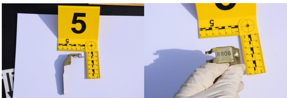
Slika 11. Trag br. 5. – žlica ručne bombe

Pregledom makadamsko-travnate površine na udaljenosti 17 cm u pravcu juga od PTM, a potom 92 cm u pravcu istoka, na površini od oko 3x3,5 cm, uočene su četiri metalne kuglice promjera oko 0,3cm, tamnije boje (označeno rednim brojem 7, fotografirano, izuzeto u papirnati omot br. 5). Prije navedenog kriminalistički tehničar je zaštitio ruke gumenim rukavicama s kojima je uzeo s metalnih kuglica kontrolni bris na trakicu za uzorkovanje eksploziva, te je navedena trakica pakirana u papirnati omot i zatim u plastični omot (označen kao 5A), a rukavice su nakon korištenja pakirane u papirnati KT (označeno kao omot 5B).