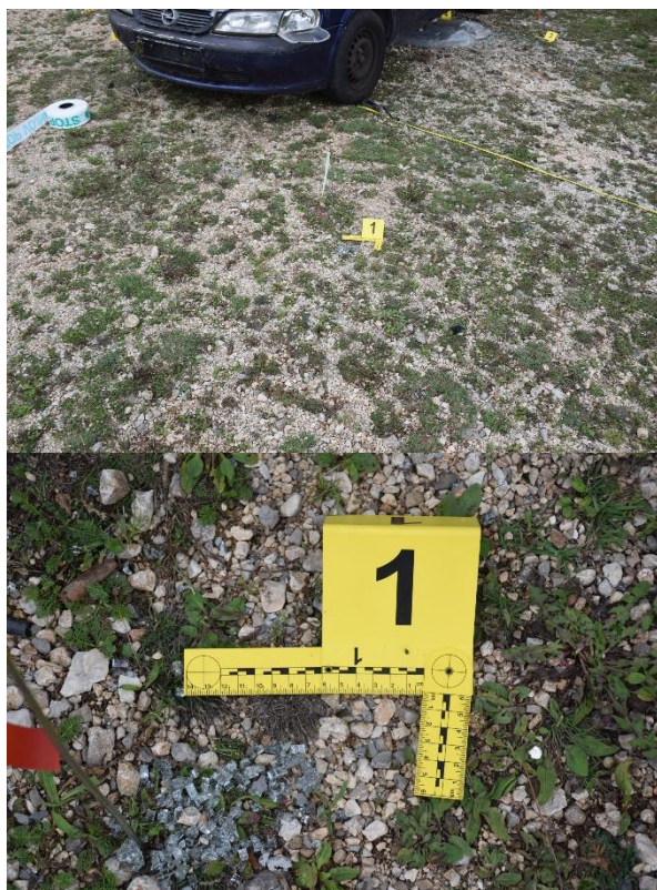
Slika 22. Fragmenti stakla

Pregledom mjesta događaja na šljunčanoj podlozi djelomično obrasloj travom na udaljenosti 90 cm, mjereno od PTM u smjeru juga, a potom 117 cm mjereno od PTM u smjeru zapada pronađeni su fragmenti stakla raznih veličina (fotografirano i označeno kao trag br. 1).