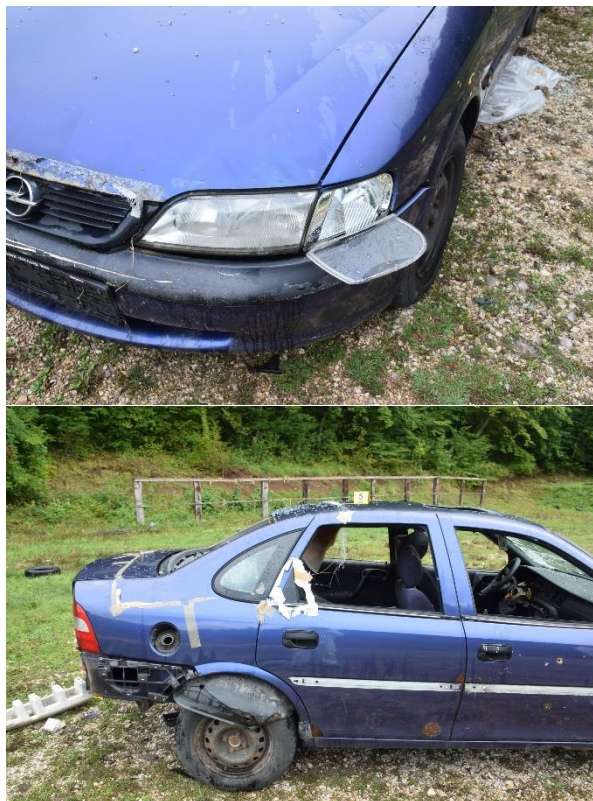
Slika 29. Prednji desni dio vozila

Na stražnjoj desnoj bočnoj strani uočen je nedostatak PVC rešetke te nedostatak poklopca otvora gdje se nalazi čep spremnika goriva.