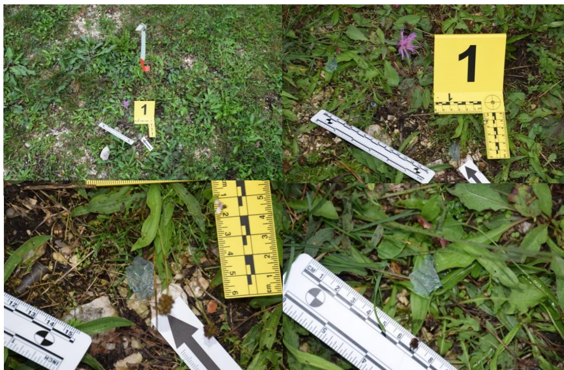
Slika 6. Trag br. 1 – fragmenti stakla

Pregled mjesta događaja je izvršen na spiralni način od perifernog dijela prema središtu mjesta događaja na kojem se nalazilo vozilo. Na taj način su pronađeni, opisani i fotografirani dolje navedeni tragovi. Pregledom makadamske podloge, na udaljenosti 10,27 m od PTM u pravcu juga, a potom do 10,33 m od PTM u pravcu istoka pronađena je veća količina fragmenata razbijenog stakla veličine do 1,5x2x0,5 cm, koja se nalazila na površini oko 14,30x11,20 m (označeno br. 1.).