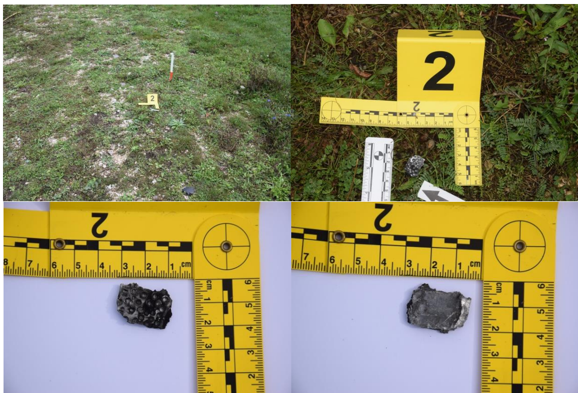
Slika 7. Trag br. 2. – fragmenti eksplozivnog sredstva

Daljnijim pregledom makadamske površine na udaljenosti od PTM u pravcu juga 1,20 m, a potom 4,45 m u pravcu istoka pronađen je fragment metala veličine 2,5x1,5x0,4 cm, s čije gornje, zatečene strane se uočava više utisnuća u metalu po cijeloj površini, promjera do 0,3 cm te oblih oblika veličine od 0,3 do 0,5 cm, utisnutih do oko 0,3 cm. Dinamičkim dijelom očevida, na stražnjoj strani pronađenog fragmenta nisu uočeni tragovi utisnuća, dok su na rubovima uočeni tragovi loma metala, a organoleptičkom metodom utvrđen je miris karakterističan za eksploziju (označeno brojem 2, fotografirano, izuzeto u papirnati omot br. 1). Prije navedenog kriminalistički tehničar je zaštitio ruke gumenim rukavicama s kojim je uzeo s fragmenta metala kontrolni bris na trakicu za uzorkovanje eksploziva, te je navedena trakica pakirana u papirnati omot i zatim u plastični omot (označen kao 1A), a rukavice su nakon korištenja pakirane u papirnati KT (označeno kao omot 1B). Na pronađenom fragmentu metala su vidljiva udubljena i njihov promjer karakterističan za eksploziju ručne bombe M 75. Strana fragmenta metala na kojoj su nastala udubljenja je tamnije boje zbog djelovanja plinova nastalih prilikom eksplozije od suprotne strane što upućuje na položaj fragmenta metala na kojem se nalazio prilikom eksplozije. Nepravilni rubovi fragmenta metala upućuju da je prilikom eksplozije odlomljen i odbačen od mjesta eksplozije.