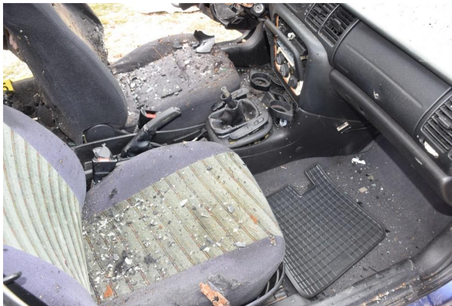
Slika 31. Središnje konzola

Daljnji tijek očevida nastavljen je u unutrašnjosti automobila kojom prilikom je pregledom unutarnje obloge zadnjih lijevih vrata u blizini rukohvata na visini 33,5 cm od donjeg ruba vrata, a potom na udaljenosti 53 cm od stražnjeg ruba uočeno mehaničko oštećenje u vidu kidanja tkanine i plastike. Pregledom suvozačevih vrata s unutarnje strane, na oblozi istih se ispod rukohvata, na udaljenosti do 49 cm od prednjeg ruba te na visini do 35 cm od donjeg ruba vrata, pronalazi mehaničko oštećenje u vidu probijanja tkanine obloge, čiji su rubovi oštećenja usmjerena prema unutra.