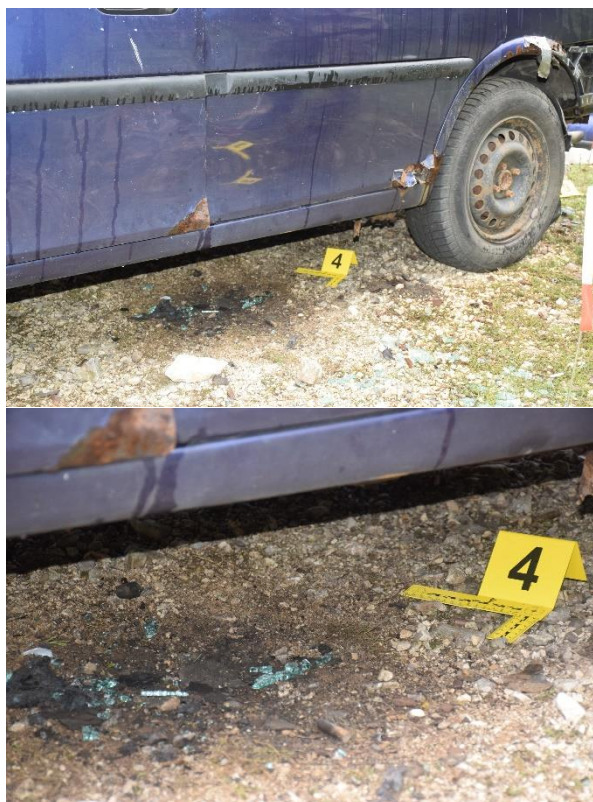
Slika 25. Tragovi na površini automobila

Na udaljenosti od 86 cm mjereno od PTM u smjeru juga, a zatim 405 cm mjereno u smjeru istoka pronađen je komad tkanine veličine 3x5 cm sa vidljivim tragovima kidanja tkanine (fotografirano i označeno kao trag br. 6, tkanina je izuzeta i pakirana u staklenku (zbog moguće komparacije) i zatim u dvije plastične vrećice, a potom u papirnati KT omot označen kao omot 3). Zbog postojanja mogućnosti da tkanina pripada počinitelju, kriminalistički tehničar je zaštitio ruke gumenim rukavicama s kojima je pakirao komad tkanine u papirnati omot te zatim u plastični omot (označen kao 3A), a rukavice su nakon korištenja pakirane u papirnati KT (označeno kao omot 3B). Po završetku očevida omot se šalje na vještačenje u „Centar za forenzična ispitivanja i vještačenja Ivan Vučetić“ na DNA analizu.