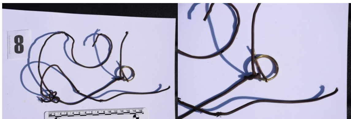
Slika 16. Električni kabel

U nalogu za vještačenje pitanje vještaku kod DNA analize glasi: „Nalaze li se na dostavljenom (predmetu/omot br.6) biološki tragovi humanog podrijetla, te ukoliko se nalaze, izvršiti analizu DNA i rezultat usporediti s DNA profilima pohranjenim u bazi podataka DNA profila Centra“.