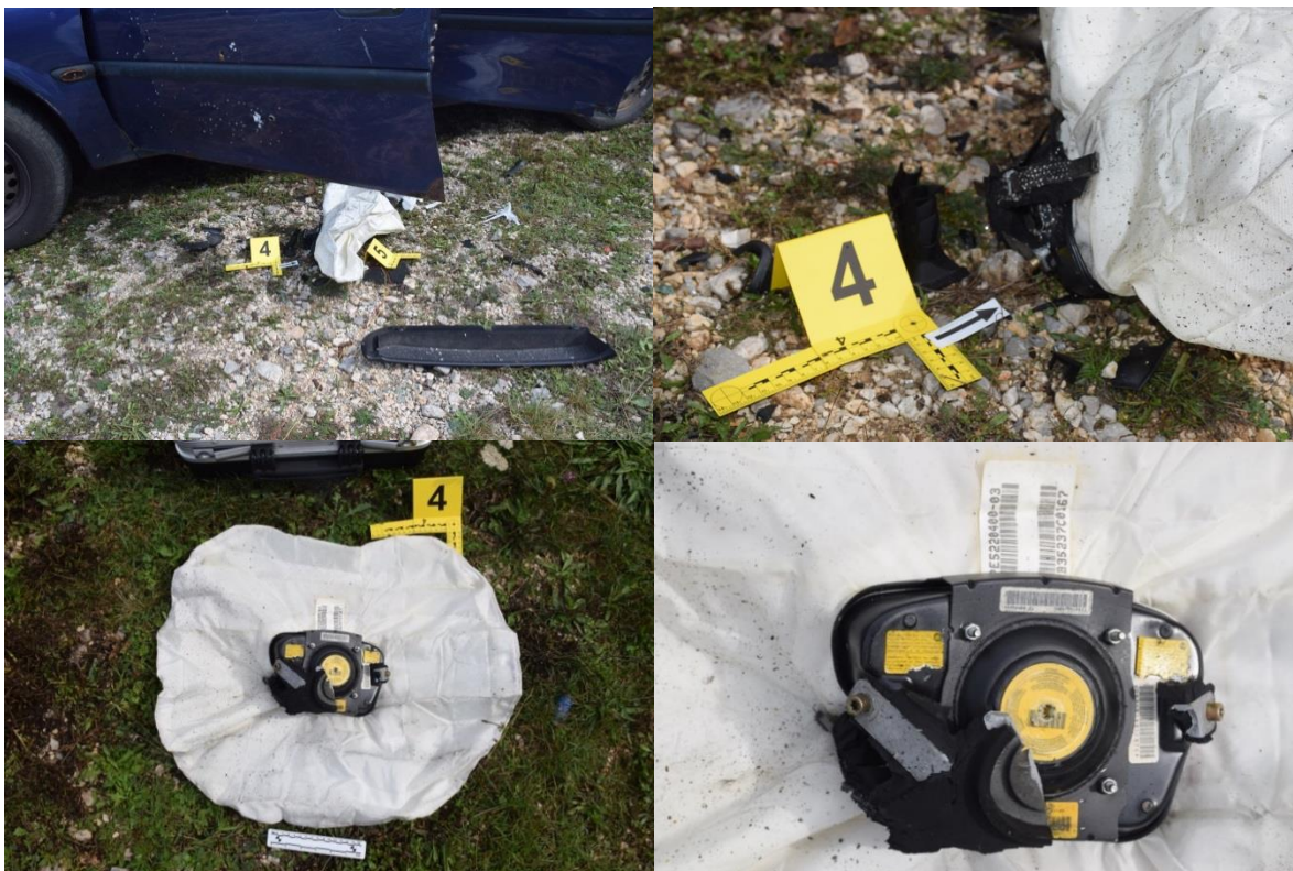
Slika 9. Trag br. 4. – fragmenti eksplozivnog sredstva

Ispod spomenutog zračnog jastuka, na makadamskoj travnatoj površini pronađena je žlica ručne bombe, u oblika slova „L“, veličine oko 9x2 cm. Pregledom gornje plohe žlice uočen je otisnut broj 9068, a u čijem se mjestu predviđenom za osigurač uočava nedostatak istog (označeno rednim brojem 5, fotografirano, izuzeto u papirnati omot br. 4). Kriminalistički tehničar je zaštitio ruke gumenim rukavicama s kojima je pakirao žlicu ručne bombe u papirnati omot te zatim u plastični omot (označen kao 4A), a rukavice su nakon korištenja pakirane u papirnati KT (označeno kao omot 4B). Po završetku očevida omot se šalje na vještačenje u „Centar za forenzična ispitivanja i vještačenja Ivan Vučetić“ na DNA analizu i daktiloskopsku pretragu (DKT).