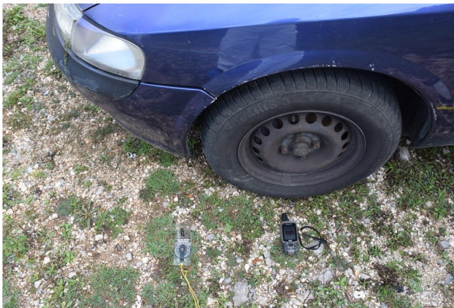
Slika 4. Određivanje FTM i PTM, GPS uređajem

Za fiksnu i početnu točku mjerenja (u daljnjem tekstu PTM) uzima se prednji lijevi kotač automobila Opel Vectra, koja je određena uređajem Garmin marke GPSmap 60CSX, na koordinatama N 44° 33' 25.708" i E 015° 47' 53.586".