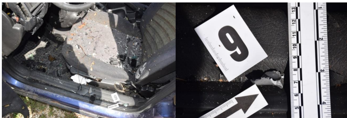
Slika 18. Traga br. 9. – rasuti fragmenti metala