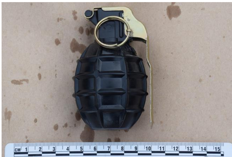
Slika 1. Ručna bomba M 75

Ukupna težina bombe iznosi 355 grama, od čega se oko 38 grama odnosi na masu plastičnog eksploziva koji se nalazi u tijelu bombe i koji rasprsnućem tijela bombe daje ubojitu moć čeličnim kuglicama.