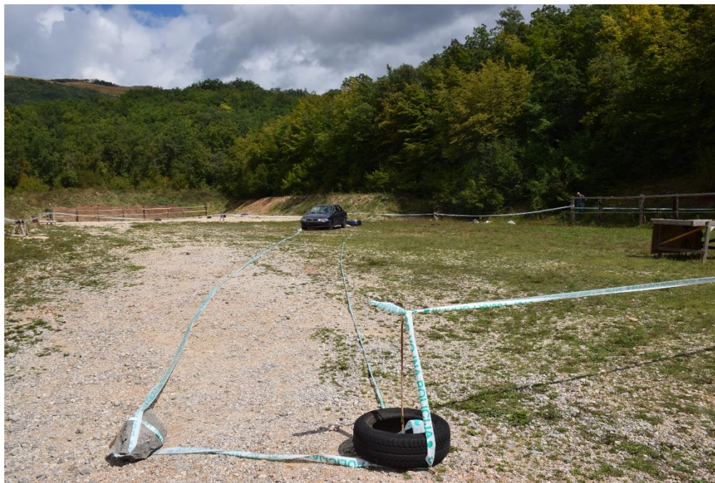
Slika 21. Osiguranje mjesta događaja