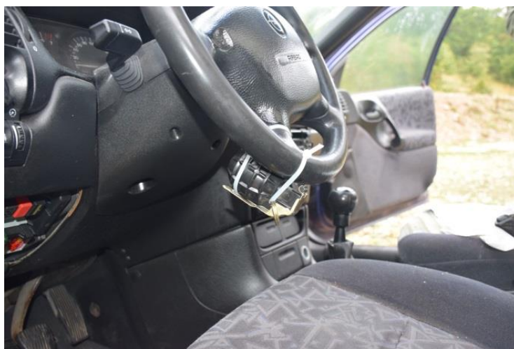
Slika 2. Postavljanje ručne bombe M 75 na upravljač vozila

Scenarij vježbe se odnosio na provođenje očevida prilikom podmetanja ručne bombe M 75 od strane nepoznate osobe (NN osobe) u osobnom vozilu marke „Opel Vectra“ u vlasništvu djelatne vojne osobe (DVO), na način da je ručna bomba M 75 pričvršćena s unutrašnje strane upravljača vozila plastičnim vezicama, a osigurač bombe je konopcem vezan za rukohvat s unutrašnje strane vozačevih vrata, čime bi vlasnik vozila otvaranjem vozačevih vrata izvršio aktiviranje bombe.