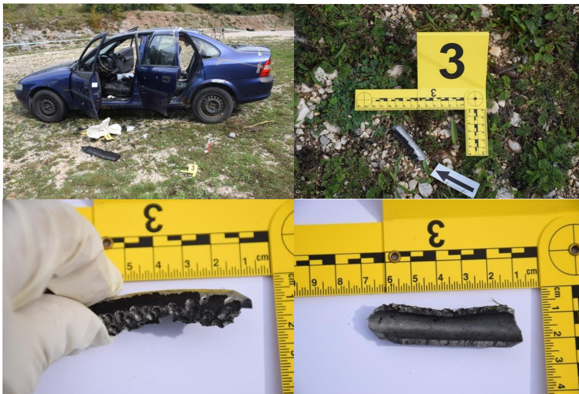
Slika 8. Trag br. 3. – fragmenti eksplozivnog sredstva

U razini vozačevih vrata automobila, na makadamskoj podlozi, na površini veličine oko 120x160 cm pronađeno je više fragmenata iz unutrašnjosti vozila između kojih je pronađen i dio upravljača, kućište zračnog jastuka, gdje se na donjem dijelu kućišta uočilo trganje i savijanje metala, te utisnuća okruglih i ovalnih oblika veličine do 0,4x0,5 cm, dubine do oko 0,4 cm. Organoleptičkom metodom utvrdio se miris karakterističan za eksploziju. Pregledom zračnog jastuka uočilo se kako je isti otvoren, izgužvan, a na istom je zatečeno manja količina sitnih tamnih čestica (označeno rednim brojem 4, fotografirano, izuzeto u papirnati omot br.3). Obzirom da su se navedeni fragmenti unutrašnjosti vozila nalazili na podlozi u razini vozačevih vrata što upućuje da je eksplozija nastala prilikom otvaranja ili širom otvorenih vrata. Također je izvršen kontrolni bris na trakicu za uzorkovanje eksploziva na način da je kriminalistički tehničar zaštitio ruke gumenim rukavicama s kojima je uzeo sa zračnog jastuka kontrolni bris na trakicu za uzorkovanje eksploziva, te je navedena trakica pakirana u papirnati omot i zatim u plastični omot (označen kao 3A), a rukavice su nakon korištenja pakirane u papirnati KT (označeno kao omot 3B).