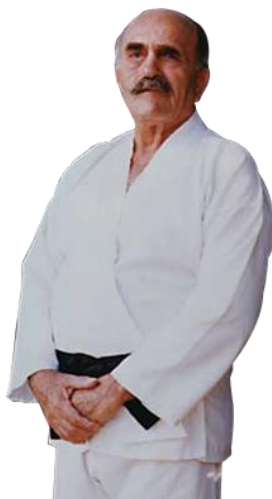
Slika 4. Imi Sde - Or Lichtenfeld

Začetnik Krav Mage je Imi Sde – Or Lichtenfeld koji je razvio sustav i utjelovio borbenu vještinu Krav Maga tijekom svoje izvanredne vojne karijere na mjestu glavnog nadglednika IDF – a. Za vrijeme svoje službe napisao je vojni službeni priručnik za samoobranu i bliske borbe. Godine 1964. napustio je policiju, unatoč tome što je nastavio nadzirati upute Krav Maga, kako u vojnoj tako i u kontekstu javne sigurnosti, a također je neumorno radio na poboljšanju i prilagođavanju ove discipline u potrebe cjelokupnog građanstva. Na slici 4 prikazan je Imi Sde – Or Lichtenfeld, začetnik i osnivač borbene vještine Krav Maga [20].