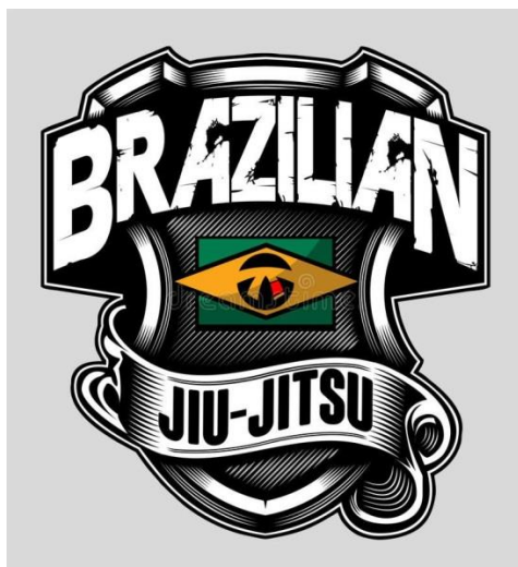
Slika 7. Brazilski Jiu Jitsu, logo