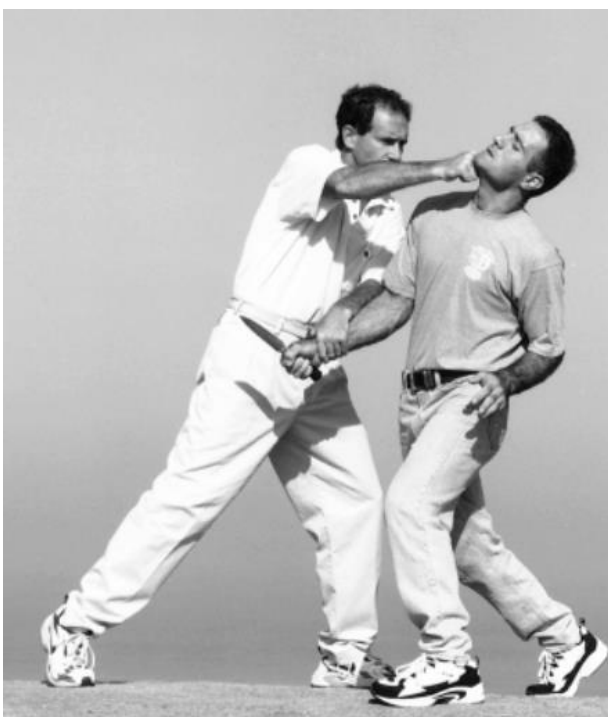
Slika 5. Krav Maga obrana od napada nožem Preuzeto s:[19] . Posjećeno dana 26.06.2020

Kada se uče principi i metode sustava obrane Krav Mage potrebno je koristiti meki nož u prvih nekoliko vježbi, a nakon toga početi vježbati s još jednim nožem izrađenim od drveta ili plastike. U naprednijim fazama može se koristiti oštri metalni nož uz poštivanje svih potrebnih mjera sigurnosti. Osoba koja uči principe ove borilačke vještine mora se naviknuti na osjećaj da se brani od pravog napada nožem [19]. Na slici broj 5 prikazan je primjer korištenja Krav Maga borilačke vještine u slučaju obrane od napada nožem.