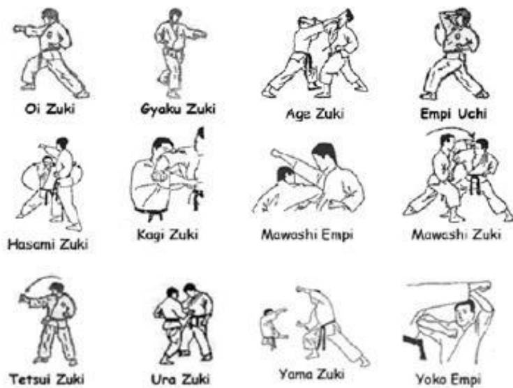
Slika 8. Osnovne tehnike karatea