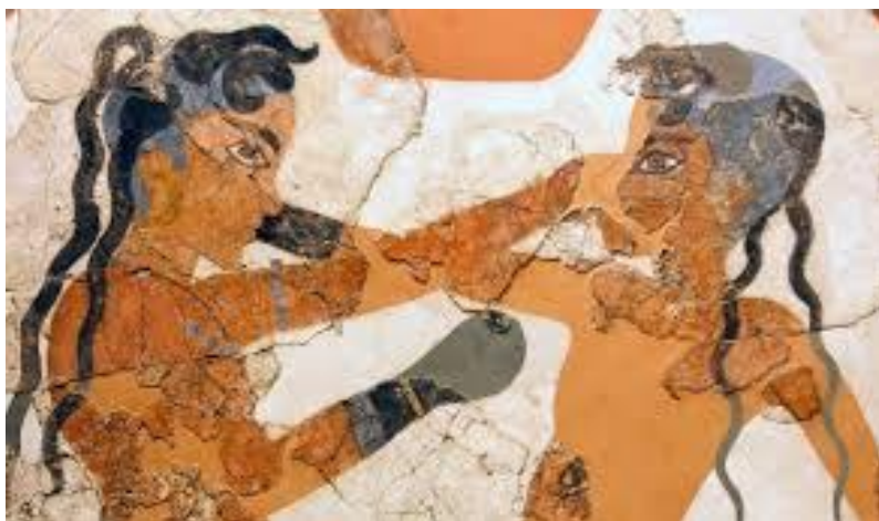
Slika 3. Freska pronađena na otoku Thiri Preuzeto s: [14]. Posjećeno dana 23.06.2020.