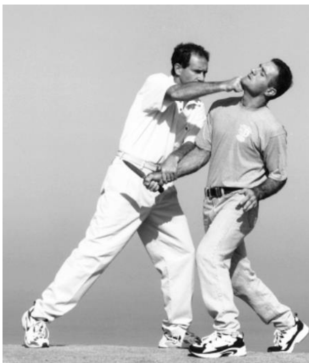
Slika 5. Krav Maga obrana od napada nožem Preuzeto s:[19] . Posjećeno dana 26.06.2020

Kada se uče principi i metode sustava obrane Krav Mage potrebno je koristiti meki nož u prvih nekoliko vježbi, a nakon toga početi vježbati s još jednim nožem izrađenim od drveta ili plastike. U naprednijim fazama može se koristiti oštri metalni nož uz poštivanje svih potrebnih mjera sigurnosti. Osoba koja uči principe ove borilačke vještine mora se naviknuti na osjećaj da se brani od pravog napada nožem [19]. Na slici broj 5 prikazan je primjer korištenja Krav Maga borilačke vještine u slučaju obrane od napada nožem.