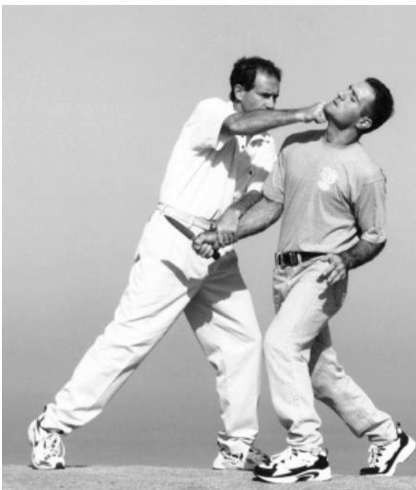
Slika 5. Krav Maga obrana od napada nožem Preuzeto s:[19] . Posjećeno dana 26.06.2020

Kada se uče principi i metode sustava obrane Krav Mage potrebno je koristiti meki nož u prvih nekoliko vježbi, a nakon toga početi vježbati s još jednim nožem izrađenim od drveta ili plastike. U naprednijim fazama može se koristiti oštri metalni nož uz poštivanje svih potrebnih mjera sigurnosti. Osoba koja uči principe ove borilačke vještine mora se naviknuti na osjećaj da se brani od pravog napada nožem [19]. Na slici broj 5 prikazan je primjer korištenja Krav Maga borilačke vještine u slučaju obrane od napada nožem.