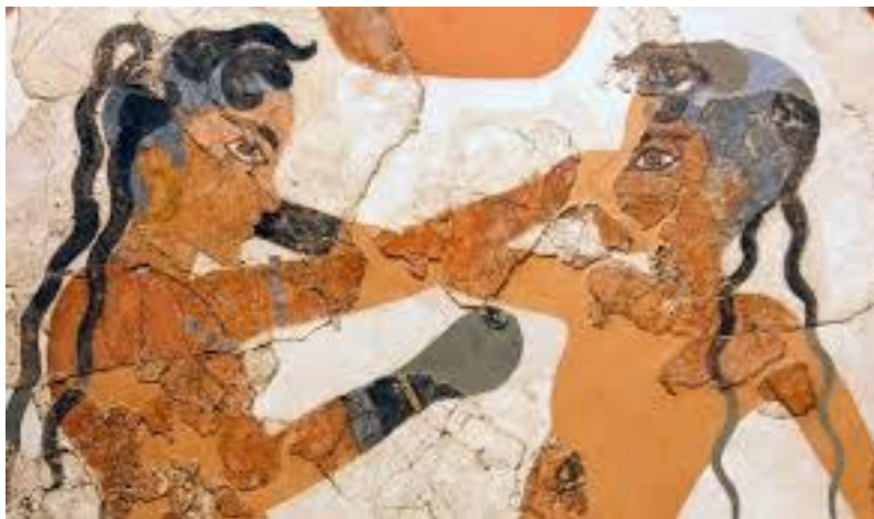
Slika 3. Freska pronađena na otoku Thiri