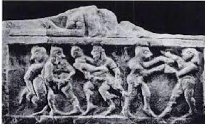
Slika 1. Reljef iz Khafaje

U prošlosti su borilačke vještine bile dio ritualnih obreda s ciljem zabave, predstave i zadovoljenja vjerskih potreba [14]. Tako se može zaključiti kako su već prve civilizacije koristile borilačke vještine kao jedan od zabavnih faktora. Na slici 1 prikazan je povijesni dokaz reljefa iz Khafaje koji prikazuje hrvanje i šakanje.