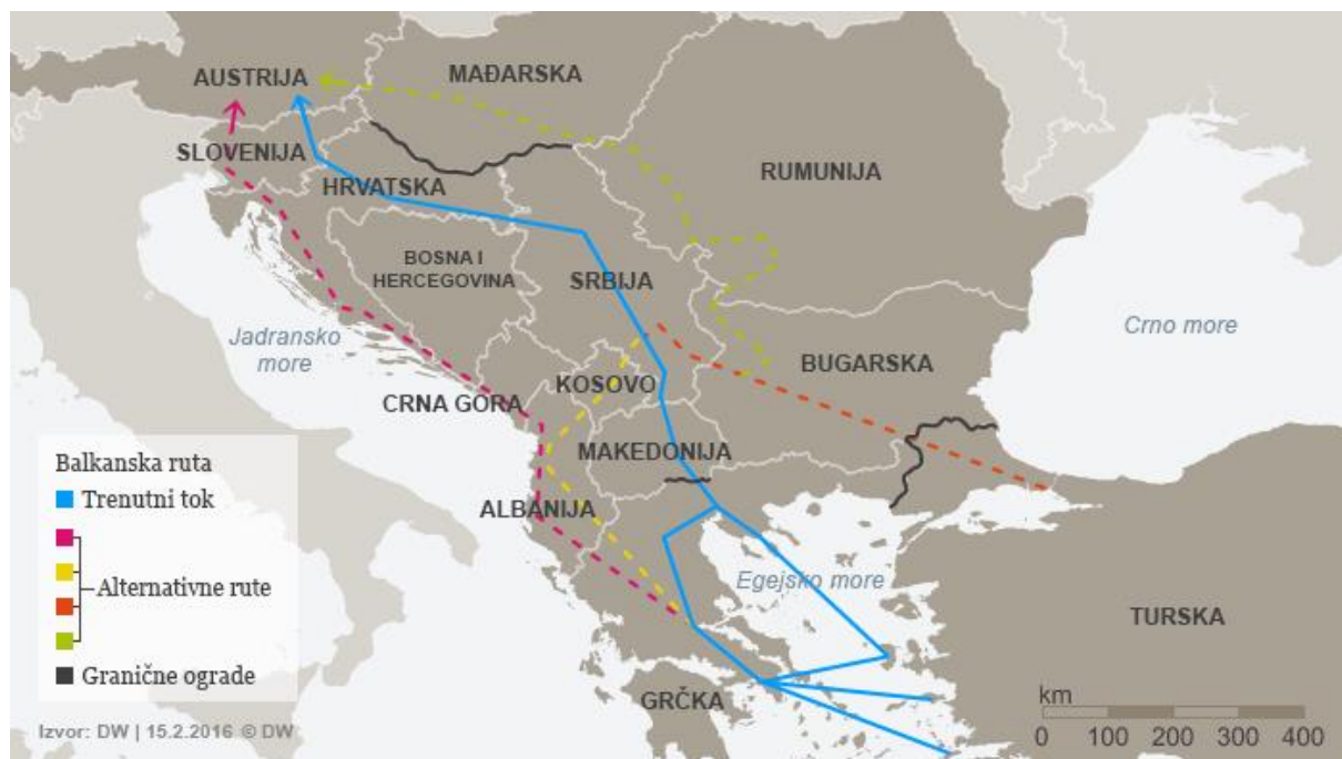
Slika 1. Balkanska ruta i alternativni pravci 2016. godine 30

2013. godini; 29 Lažne i krivotvorene putovnice nakon upotrebe oduzimaju se od krijumčarenih ljudi i ponovno vraćaju na polazišno mjesto s namjerom daljnje i ponovne uporabe.